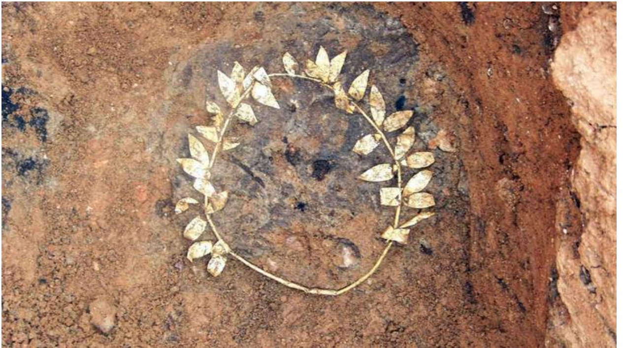
جائزة الأولمبياد عند الإغريق، الإكليل المصنوع من الشجر