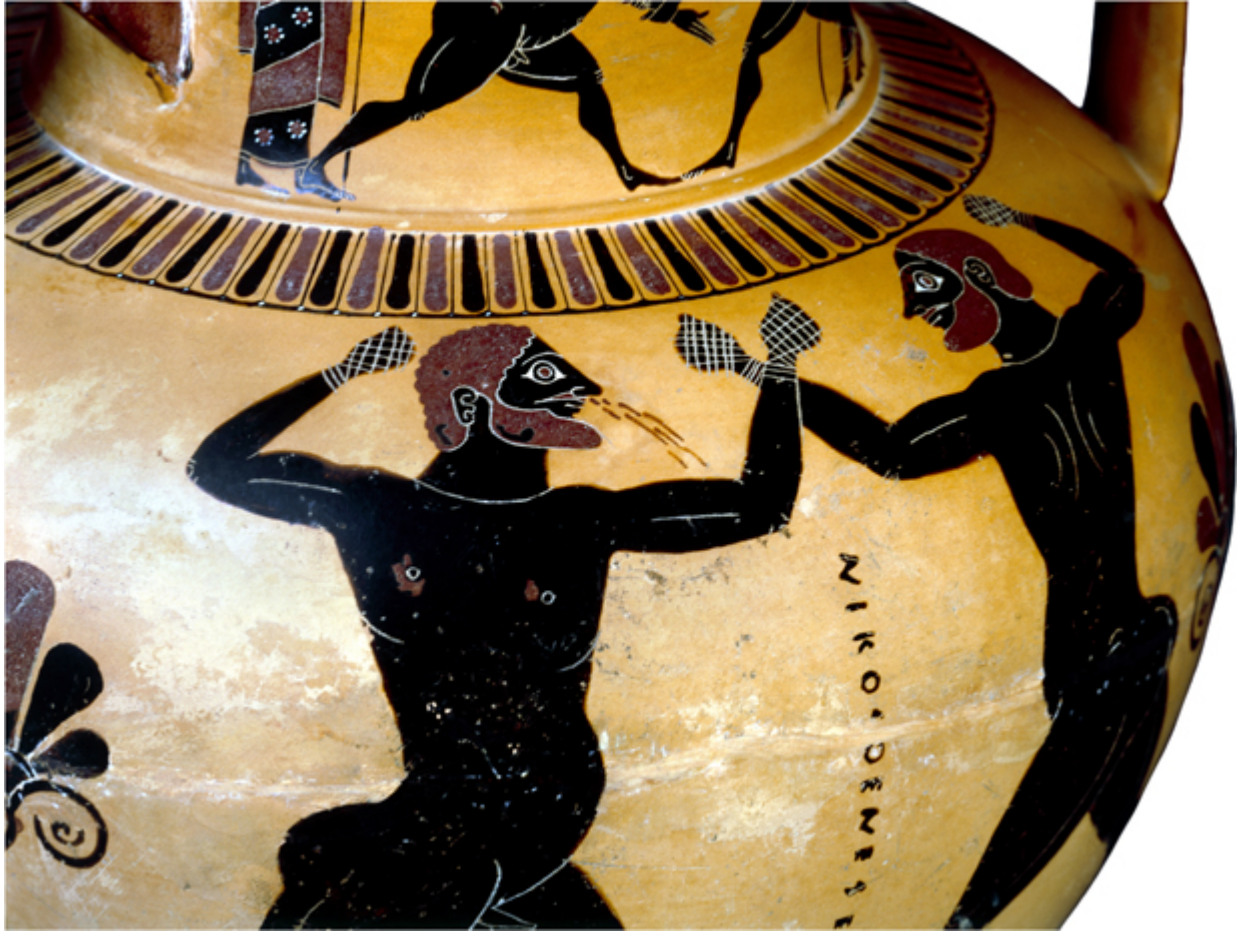
صورة تعبر عن رياضة الملاكمة، حيث ينزف أنف أحد الملاكمين في الصورة، كما كان يرتدي اللاعبين حبال جلدية يلفون بها كفوفهم أثناء اللعب