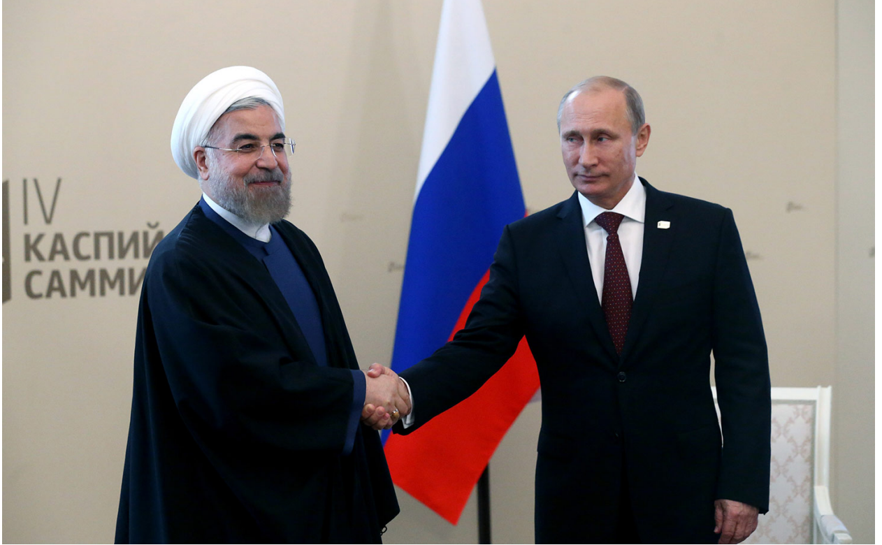
الرئيس الروسي فلاديمير بوتين ونظيره الإيراني حسن روحاني

وفي سياق آخر فإن هذا التحالف أقلق الحكومات الخليجية بصورة كبيرة، لاسيما وهو يحمل بين طياته تهديدًا واضحًا للمصالح الخليجية في المنطقة، سواء في الشق اليمني أو السوري، فضلاً عن الملفات الأخرى العالقة في الإقليم والخاصة بالتمدد الصفوي الإيراني في ظل الدعم الروسي له.