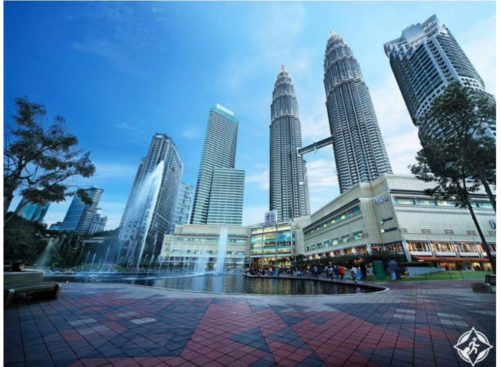
روعة الإبداع في

ثم تأتي ماليزيا في المركز الثاني حيث المتعة والإثارة، والجمع بين التراث الديني والمناظر الطبيعية الخلابة، فضلاً عن فخامة الإقامة في فنادق العاصمة كوالالابور، إضافة إلى كونها بلدًا إسلاميًا أيضًا.