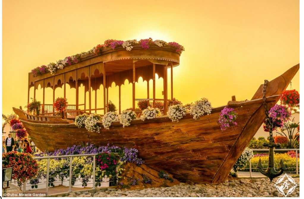
ميراكل جاردن في