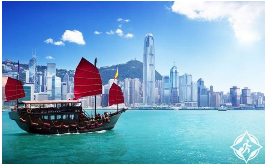
جمال الطبيعة في