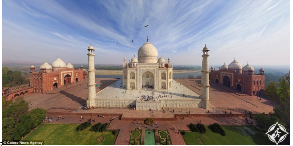
تاج محل بالهند