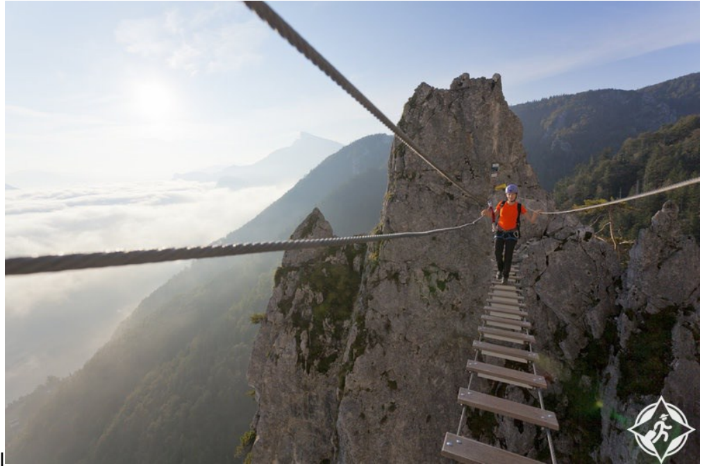
المشي فوق جبال

المميزة، إضافة إلى الرحلات الترويحية والترفيهية بها لاسيما المشي على الحبل فوق جبل الألب.