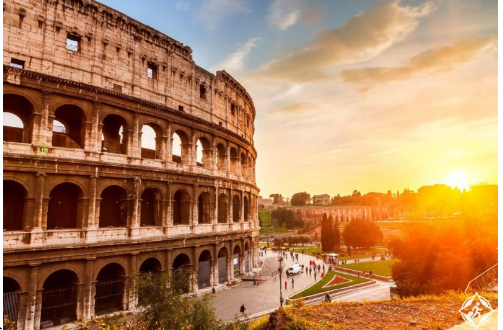
عراقة التاريخ في

ثم تأتي إيطاليا في المركز الرابع، حيث الأصالة والعراقة والحدثة في آن واحد، حين يلتقي التاريخ بالفن والموسيقى، وهو ما تجسده قصور روما ومسارحها ومعازفها التي تسحر الأذهان والعقول وتخطف الأبصار.