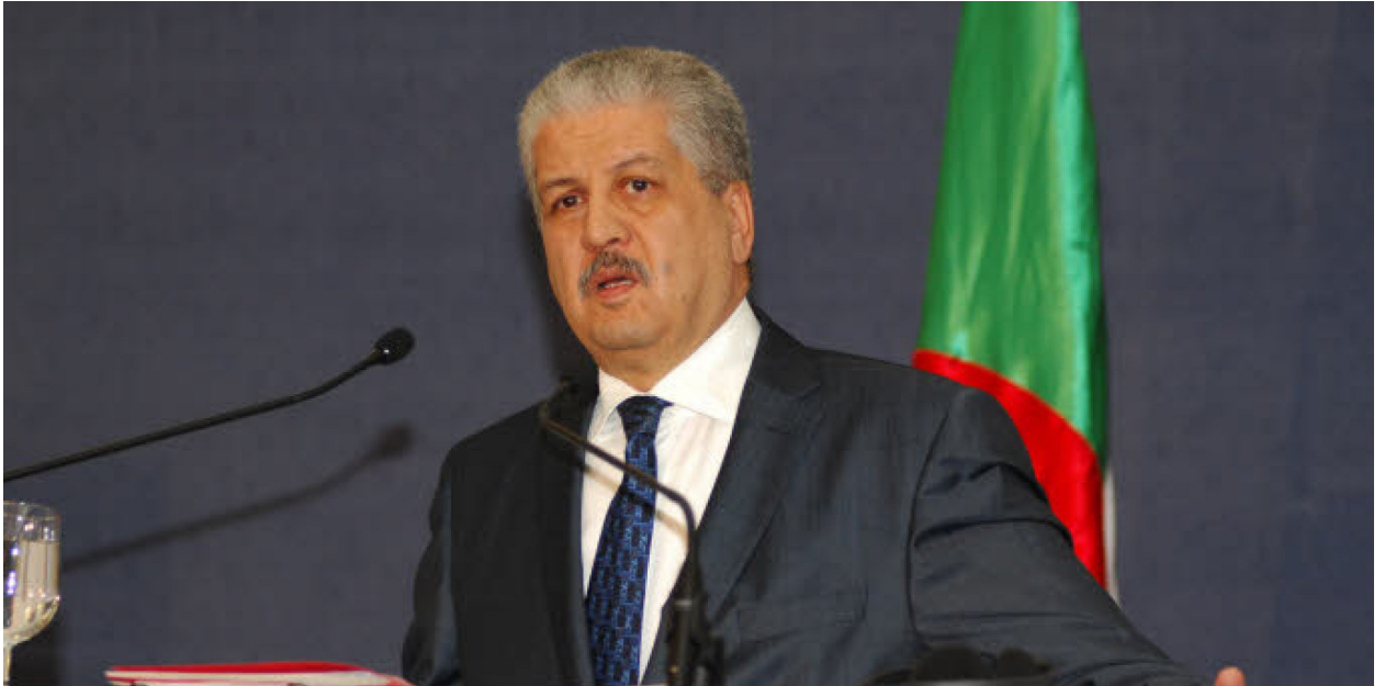
عبد المالك سلال رئيس الحكومة الجزائرية

كما أشار سلال إلى أن العلاقات السياسية بين الدولتين “ممتازة” في إطار تشاور وتنسيق مستمر حول القضايا ذات الاهتمام المشترك في الفضاءات العربية والإسلامية والدولية، فضلاً عن متانة العلاقات الاقتصادية، ما يجعل مجالات التعاون والشراكة بين البلدين كثيرة من بينها المحروقات والبتروكيماويات والفلاحة والصناعة واقتصاد المعرفة والسياحة.