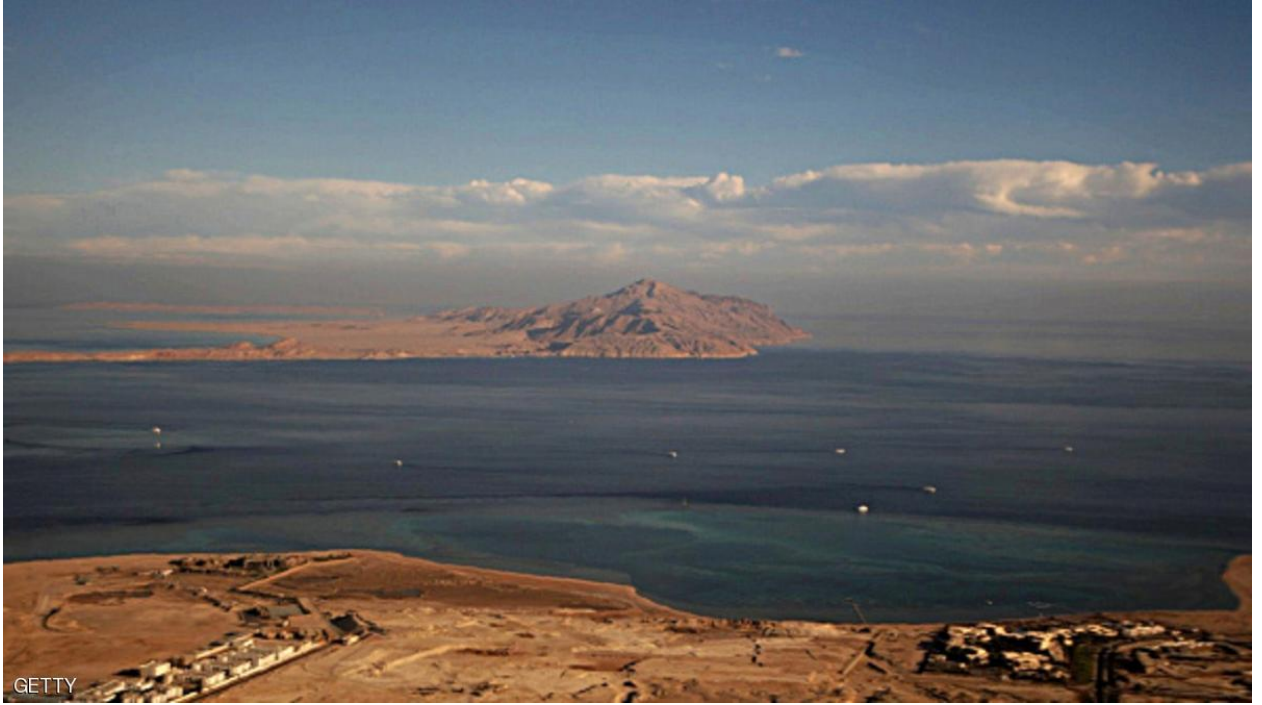
جزيرة تيران التي تنازلت عنها مصر لصالح السعودية

وهو ما أثار ضجة وجدل كبير في الشارع السياسي خلال الفترة الماضية إلا أنه بات من الواضح أن الحكومة بمشروعاتها واستراتيجياتها في واد، والشعب وهمومه وآلامه في واد آخر.