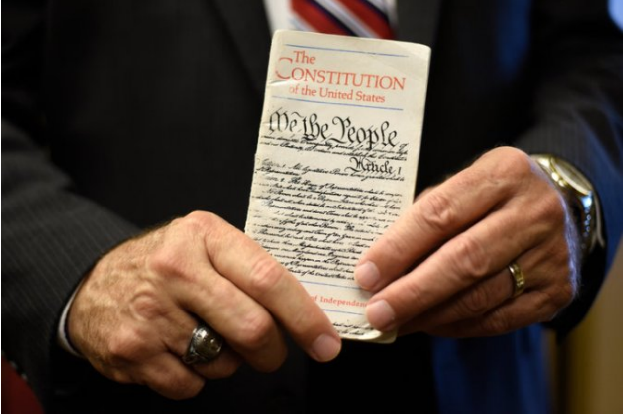
نسخة من الدستور الأمريكي

لا يُمكن أن يتم تعديل أو تغيير الدستور الأمريكي إلا عبر طلب "تعديل دستوري"، الأمر الذي لا يمكن أن يقوم به أي رئيس أمريكي، بل يجب التقدم بالطلب عبر "ولاية" أو عبر "الكونجرس"، ويكون ذلك بعد أن يصوّت ثلثي أعضاء الكونجرس بالموافقة على طلب التعديل، ثم يُحال طلب التعديل بعد ذلك إلى الولايات للتصويت عليها، ويجب أن توافق ثلاثة أرباع الولايات المتحدة على طلب تعديل الدستور.