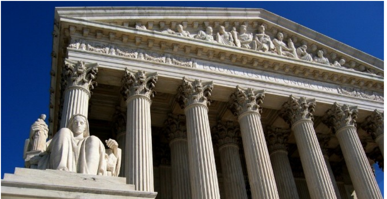
المحكمة الأمريكية العليا

المحكمة العليا أعلى هيئة قضائية في الولايات المتحدة الأمريكية، ومقرها في العاصمة واشنطن، وتأسست عام 1789 طبقاً لأحكام المادة الثالثة من الدستور الأمريكي، وتوصف المحكمة العليا بأنها "المفسر الأخير للقانون الدستوري"، حيث تقوم بمراجعة إجراءات الحكومة الاتحادية وحكومات الولايات على حد سواء، ولها سلطة إبطال أي قانون أو قرار لا يتوافق مع الحريات الدستورية الأساسية.