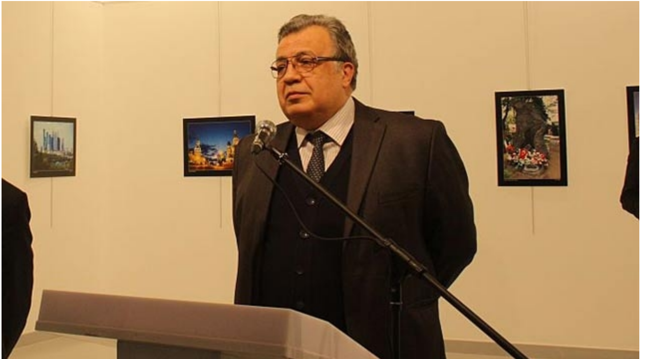
لحظات قبل اغتيال السفير