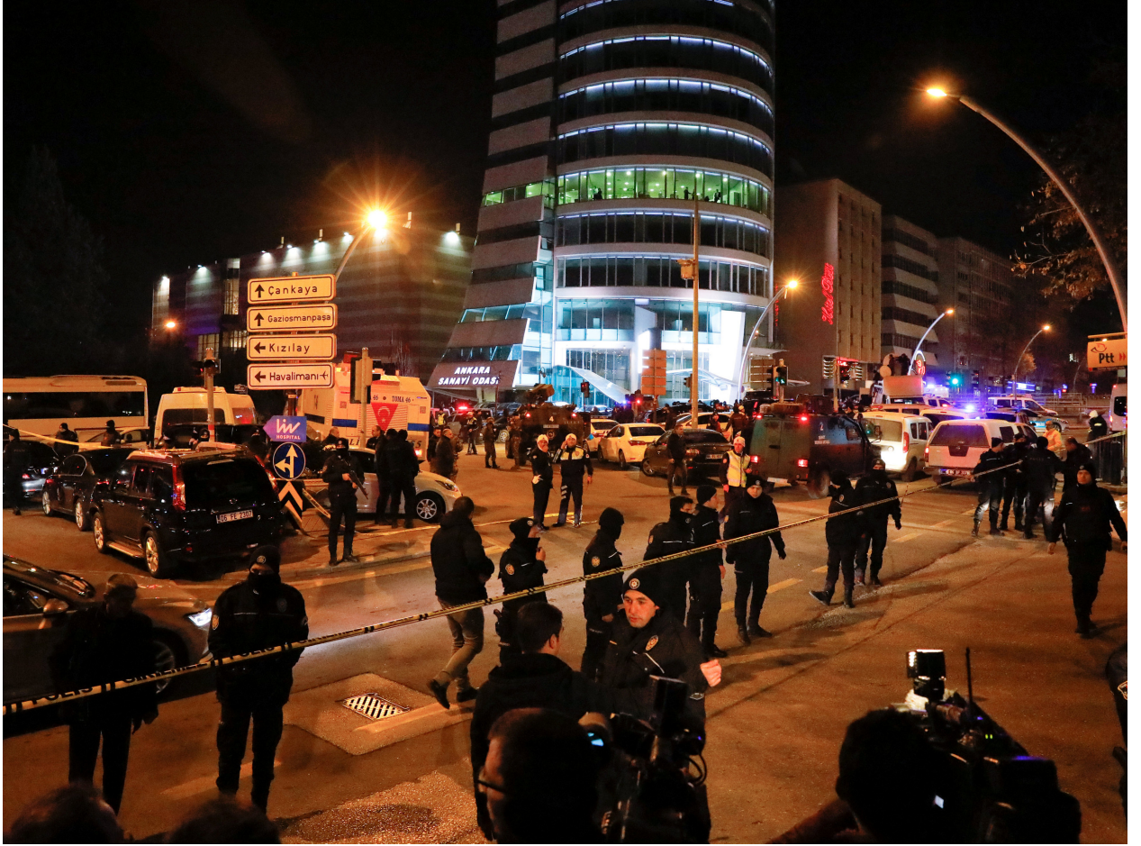
عناصر من الشرطة التركية تحيط بمكان الحادث