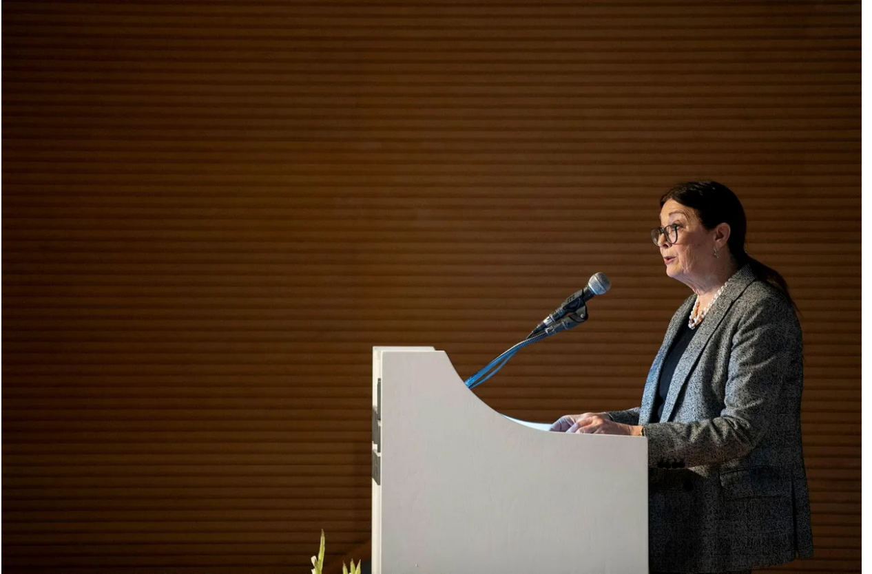
رئيسة المحكمة العليا إستر حيوت.

من أجل إنقاذ الديمقراطية الإسرائيلية يجب على قضاة المحكمة العليا أن يوضحوا أن أغلبية صغيرة في البرلمان لا يجوز لها أن تغير القواعد الأساسية للعبة الديمقراطية من جانب واحد، وأنه إذا حاول الائتلاف القيام بشيء من هذا القبيل - فإن المحكمة العليا لديها السلطة لتقويض القوانين الأساسية حتى. وقد أشارت حكومة نتنياهو بالفعل إلى أنها قد ترفض قبول مثل هذا الحكم - على الرغم من أن عدم الامتثال للمحكمة من شأنه أن يتسبب في اندلاع أزمة دستورية.