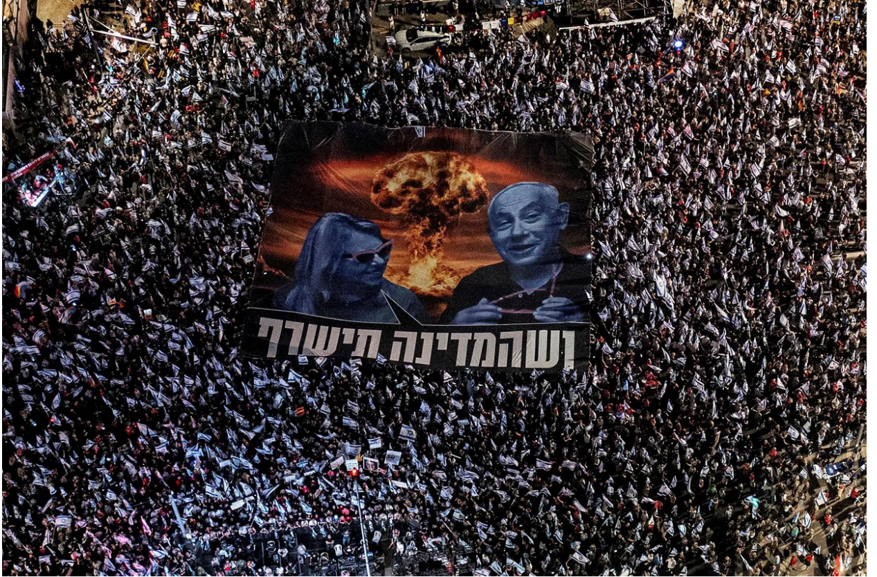
احتجاج ضد الانقلاب في شارع كابلان في تل أبيب الأسبوع الماضي.

لا يمكننا الاعتماد على انتخابات ديمقراطية مستقبلية لإزالة المتعصبين من السلطة، فهم لن يسمحوا بإجراء انتخابات حرة ونزيهة قد يتعرضون فيها للهزيمة. يعتقد المتعصبون أنهم إذا فقدوا السلطة، فسيؤدي ذلك إلى سلسلة من الإجراءات المضادة التي لا يمكنهم تقبلها، مثل المصادقة على دستور يحمي حقوق الأقليات، أو مناقشة عامة متجددة حول احتلال إسرائيل للأراضي الفلسطينية.