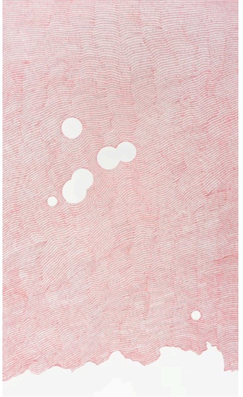
الفردوس لوحة فنية لوقاص خان، 2014

وفي هذا الإطار، يتبادر إلى أذهاننا سؤال: هل بإمكان أعمالها الفنية تغيير منظور الأمريكيين للإسلام؟ وفي هذا الصدد، أود أن أوصي بضرورة عرض الأعمال الطوباوية للفنان الباكستاني، وقاص خان، إذ أن أعماله المعقدة تعكس الحرية الأثرية لأعظم الفنون الإسلامية. وهذا هو الفن الذي بوسعه تغيير العقول والأرواح على حد سواء.