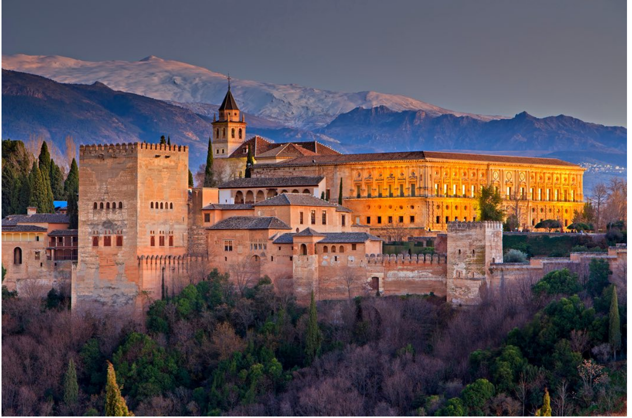
قصر الحمراء في غرناطة، إسبانيا

من جانب آخر، يعد تبجح ترامب وتفاخره (الذي يتشاركه مع عدد كبير من ناخبيه) أمرا جد عدواني خاصة فيما يتعلق برفضه التعامل مع عالم معقد بعض الشيء، والذي يبدو من غير المرجح أن يبلغ مدينة نيويورك. ولكن مما لا شك فيه، مدينة مانهاتن هي المكان الأنسب لافتتاح هذا المعهد، خاصة وأن القلوب والعقول، التي من الممكن أن يؤثر عليهم الفن العربي الإسلامي، توجد في المكان الذي صوت فيه الأغلبية لهيلاري كلينتون.