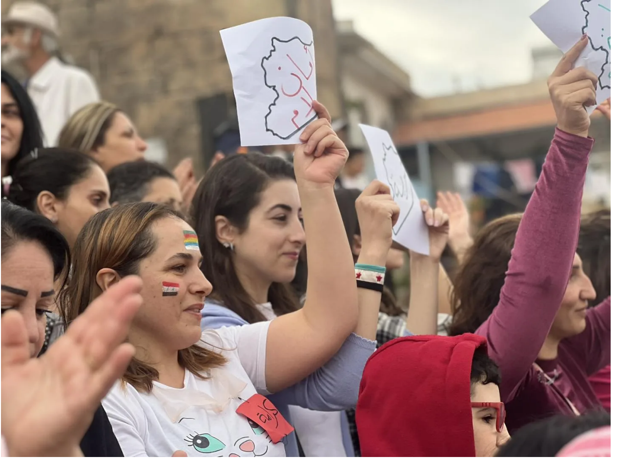
مشاركة مختلف شرائح المجتمع في الاحتجاجات السلمية في السويداء

عكست التظاهرات السلمية في محافظة السويداء منذ اندلاعها العديد من المشاهد الخاصة، على الصعيد التنظيمي وأساليب الاحتجاجات، ووحدة المطالب، والحفاظ على الأراضي السورية، وتحقيق العدالة والحرية لجميع السوريين، ما يؤكد فاعلية الحراك في المحافظة واختلافه عن التظاهرات السابقة التي شهدتها المدينة بعد اندلاع الثورة السورية في مارس/آذار 2011.