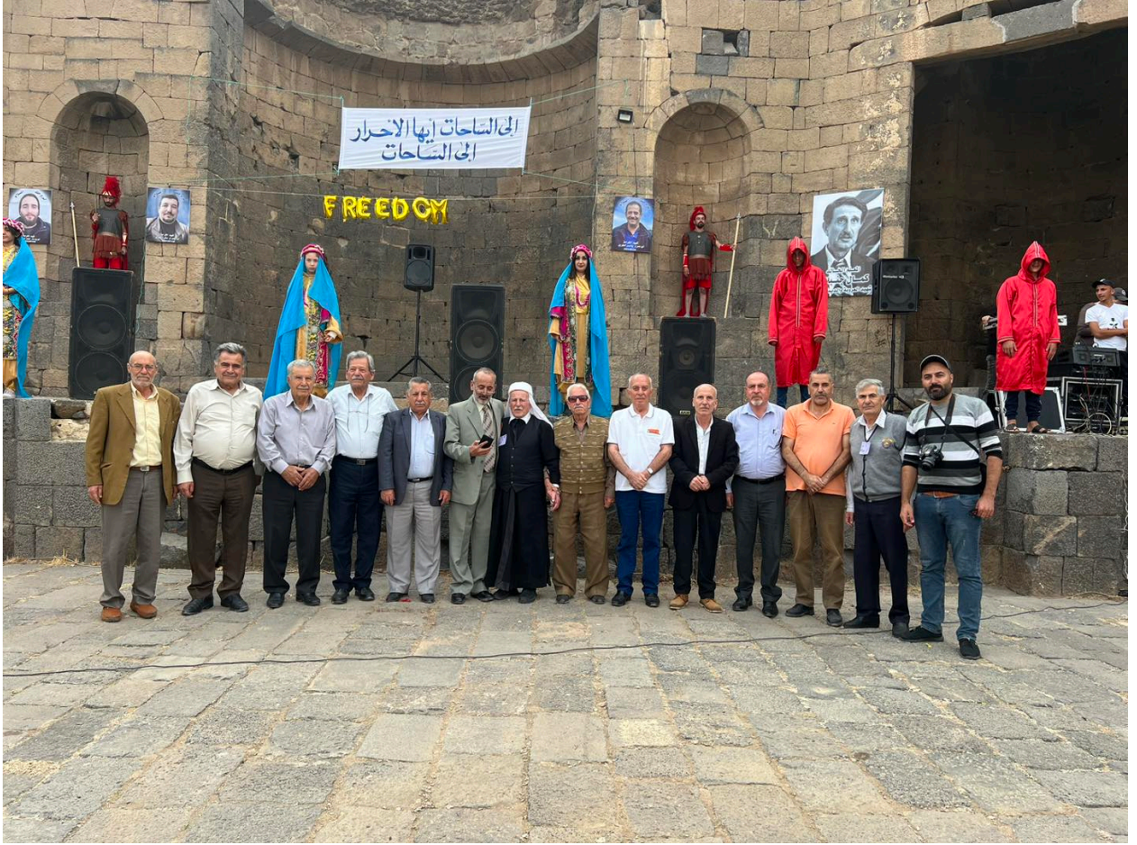
اعتصام أهالي مدينة شهباء يوم الثلاثاء 3 أكتوبر/ تشرين الأول

السلمي في السويداء، ما دفع الضباط إلى التأكيد على أنها مجرد مقترحات تهدف إلى إيجاد تمثيل مدني وعسكري للمحافظة، ولا تدعو إلى الانفصال عن سوريا.