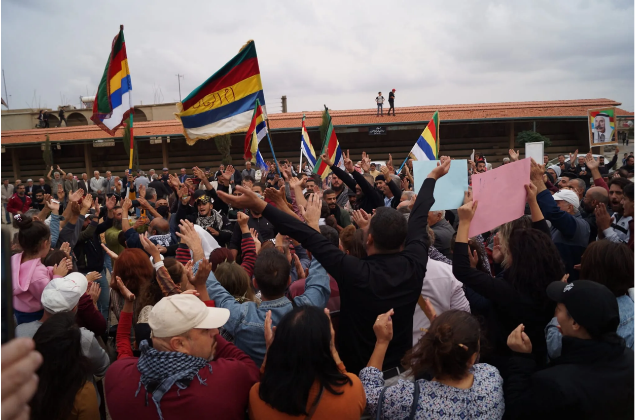
أبناء جبل العرب: "لا بديل عن إسقاط نظام الأسد"