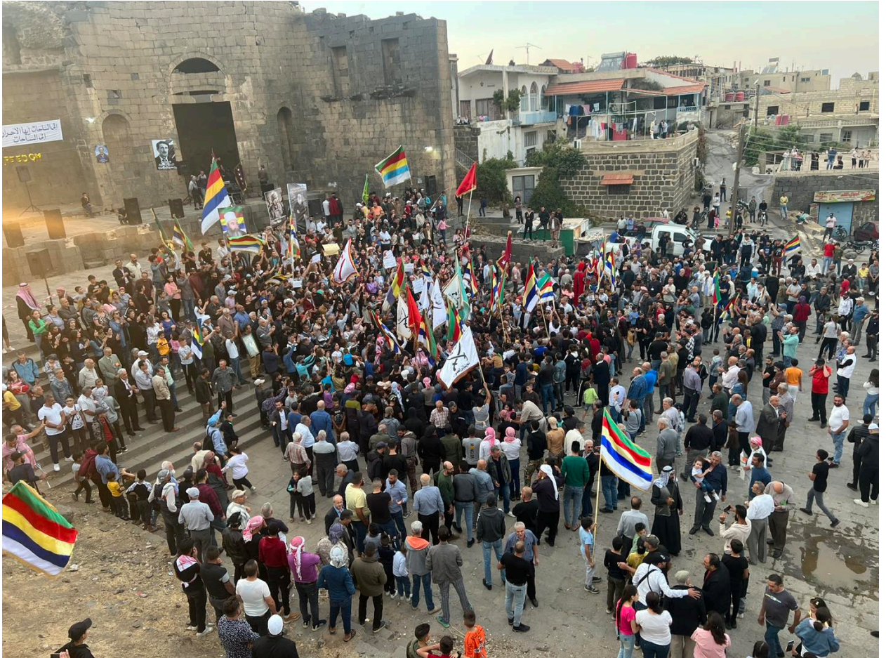
استمرار الاحتجاجات الشعبية المطالبة برحيل نظام الأسد في السويداء

ضاعفت تلك القرارات الأزمة المعيشية والاقتصادية التي يعيشها المواطنون السوريون أساسًا قبل الزيادة، ما تسبّب في احتقان الشارع ضد حكومة نظام الأسد، وخروجهم إلى الشوارع للمطالبة بتحسين الأحوال المعيشية والاقتصادية، رافضين تمامًا القرارات الحكومية غير المدروسة.