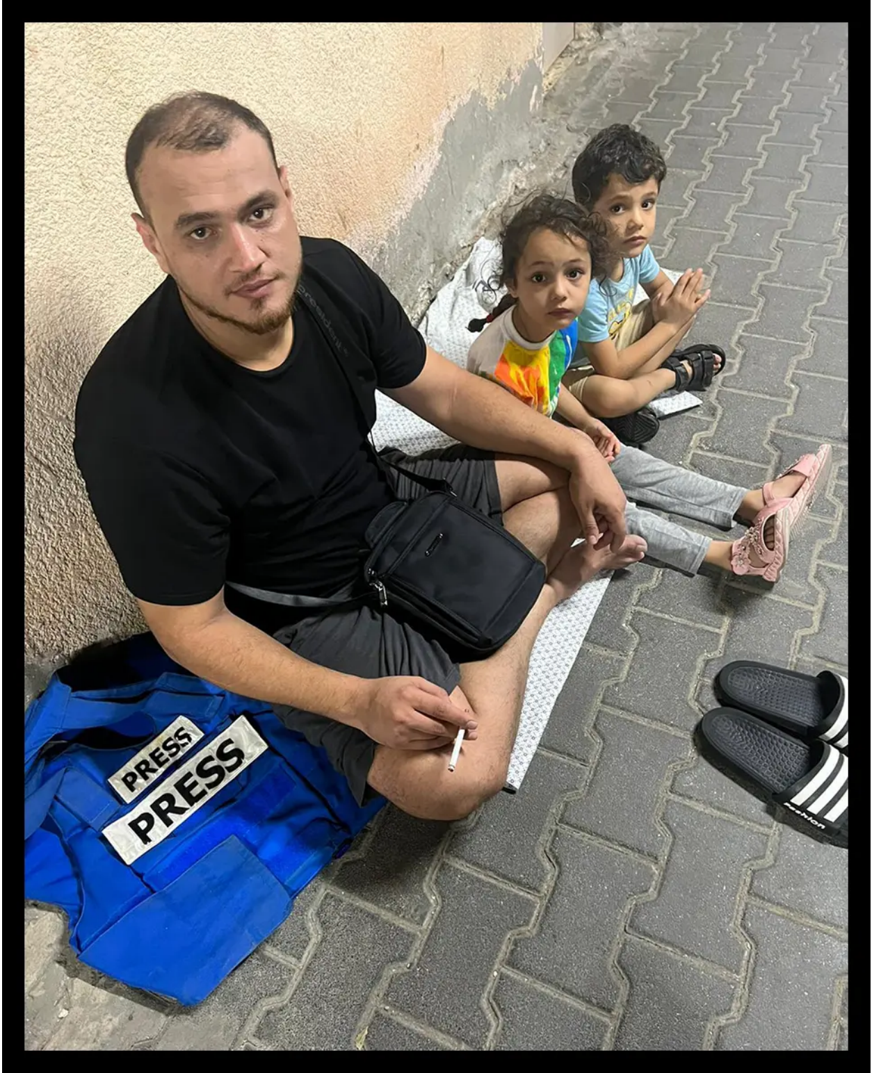
زوج حرازين وطفليها

لدينا أيضًا تحديات أخرى، لا يوجد واي فاي، لا يوجد كهرباء، لا يوجد وقود، وأقيم هنا في مستشفى شهداء الأقصى في دير البلح منذ أربعة أيام، ولا أستطيع التحرك لأن هناك غارات جوية في كل مكان.