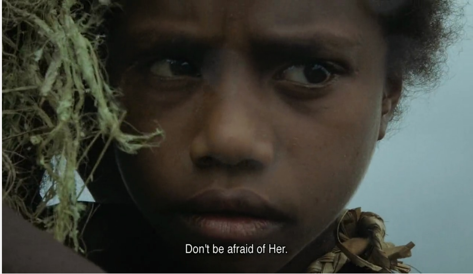
Don't be afraid of Her.

"إذا اتبعني قلبك، سينتقم الإميدين منا، وسيحل علينا الخراب.. إذا عصيتي أمرنا، فلن تجدي سوى التعاسة في حياتك" - الجدة محدثةً واوا