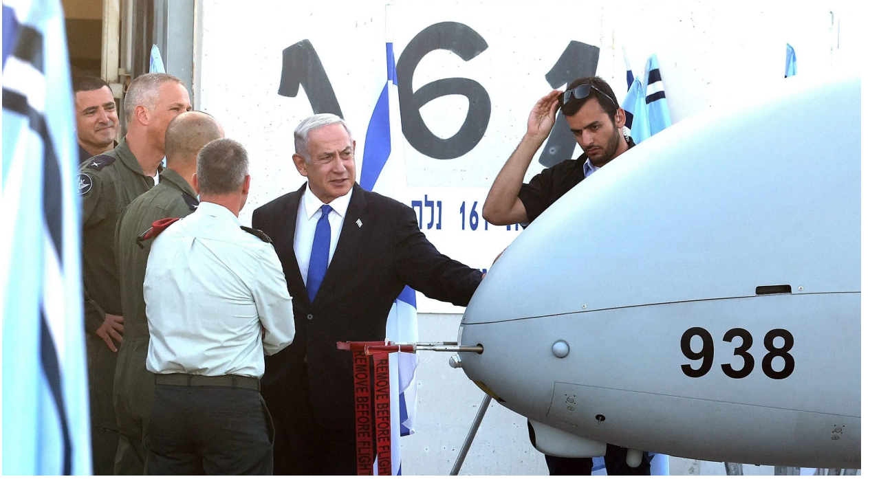
رئيس وزراء الاحتلال بنيامين نتنياهو يتفقد طائرة "هيرمس 900"

وفي عام 2014، تضاعفت مبيعات الأسلحة الإسرائيلية إلى أوروبا، وارتفعت المبيعات من 724 مليون دولار إلى 1.63 مليار دولار عام 2015، كما ارتفعت المبيعات إلى أمريكا الشمالية إلى 1.02 مليار دولار، ومن خلال إقامة علاقات وثيقة مع صناعة الأسلحة الإسرائيلية، منحت الكثير من هذه الدول الفلسطينيين نفس الماكينة التي تتمتع بها الحيوانات المستخدمة في التجارب القاسية.