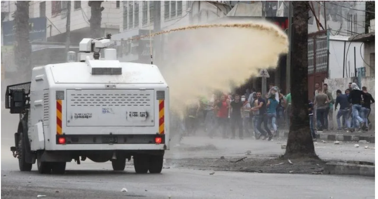
ينشر سلاح "مياه الطربان" رائحة تعشش في البيوت والجدران والثياب

إلى جانب استخدام حكومة الاحتلال "مياه الطربان" على الفلسطينيين، تقوم شركة "Odortec" أيضًا بتسويقها وتصديرها للجيوش في جميع أنحاء العالم، ففي الولايات المتحدة، يُستخدم هذا السلاح الخبيث في "المعابر الحدودية والمرافق الإصلاحية والمظاهرات والاعتصامات"، وقد اشترته العديد من أقسام الشرطة بالفعل، بما في ذلك قسم فيرجسون بولاية ميسوري، في أعقاب الاحتجاجات ضد وحشية الشرطة والعنصرية عام 2015، وتحدثت تقارير عن استخدامه في السودان في أعقاب الانقلاب الذي قاده الفريق عبد الفتاح البرهان عام 2021.