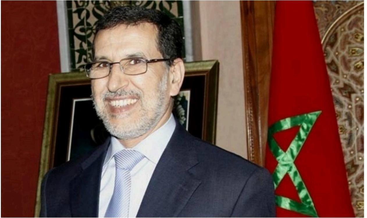
رئيس الحكومة المغربية سعد الدين العثماني

ويتمثل أول قرار تم اتخاذه، في إطلاق ورش إصلاح شامل وتحديث كلي لعمل المراكز الجهوية للاستثمار، وتشكيل لجنة بين وزارية للعمل على هذا الورش برئاسة وزارة الداخلية والقطاعات الحكومية المعنية، فيما يتمثل ثاني قرار حسب الوزير المغربي في إحداث لجنة لبحث ملف الحكامة وإصلاح الإدارة، تتكون من عدد من الوزارات برئاسة الوزارة المنتدبة لدى رئيس الحكومة المكلفة بإصلاح الإدارة والوظيفة العمومية.