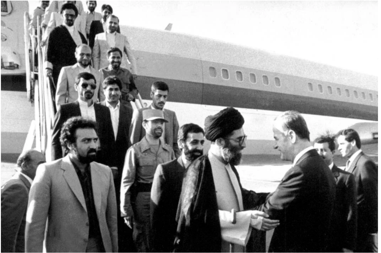
حافظ الأسد يستقبل آية الله خامنئي في مطار دمشق

وفي دراسته "المواجهة في سوريا 1982" يرى الباحث مارك فاندرفين أن حافظ الأسد في العديد من خطابه كان يبرز الفارق بين الثوريين في إيران والثوريين في سوريا، ويرسم مقارنة ضمنية بين رجال الدين في إيران والجبهة الإسلامية في سوريا، إذ يحلل فاندرفين أحد خطابات الأسد التي ألقاها في مارس/آذار 1980، وانتقد فيها دوافع المعارضة السورية مقارنة بالإيرانية، فقال: "نحن نشجع أولئك الذين يعملون من أجل الدين، ونقاتل أولئك الذين يستغلونه لأهداف غير دينية".