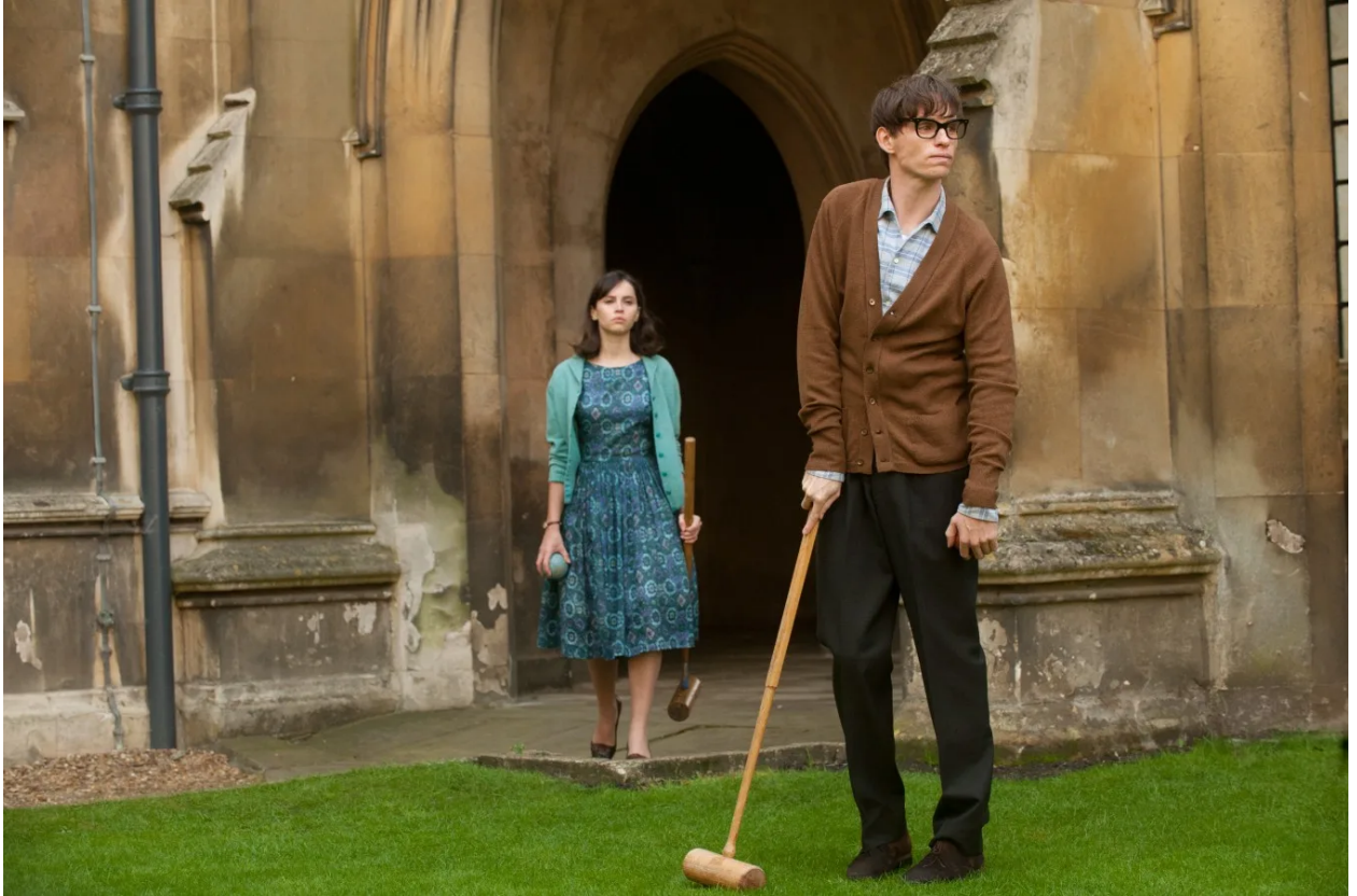
فيلم: عقل جميل (The beautiful mind)