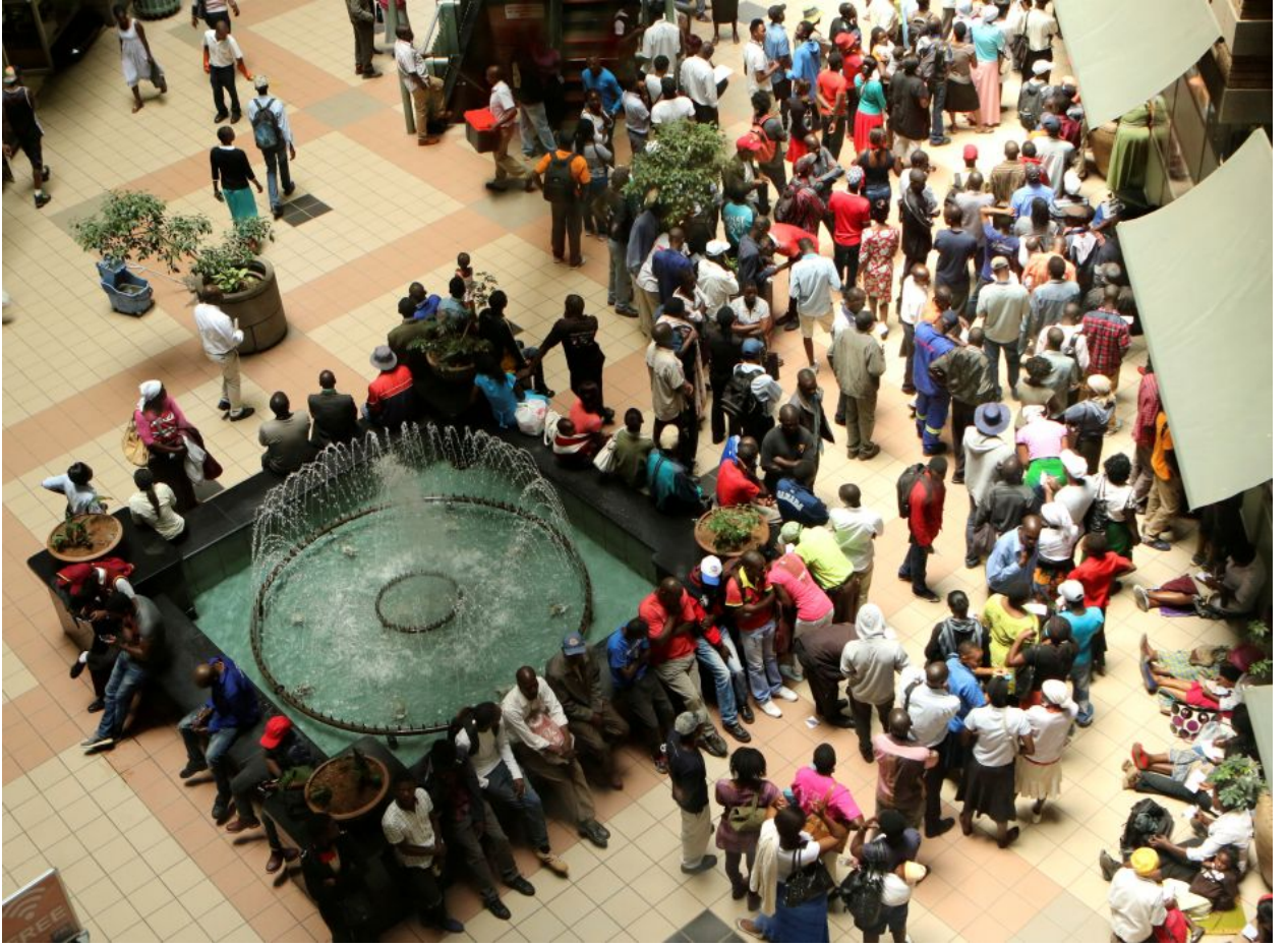
طابور من الناس لسحب الأموال في هراري عاصمة زيمبابوي