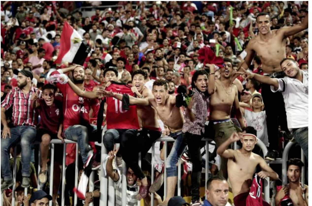
المشجعون المصريون يحتفلون بفوزهم على الكونغو في تصفيات كأس العالم