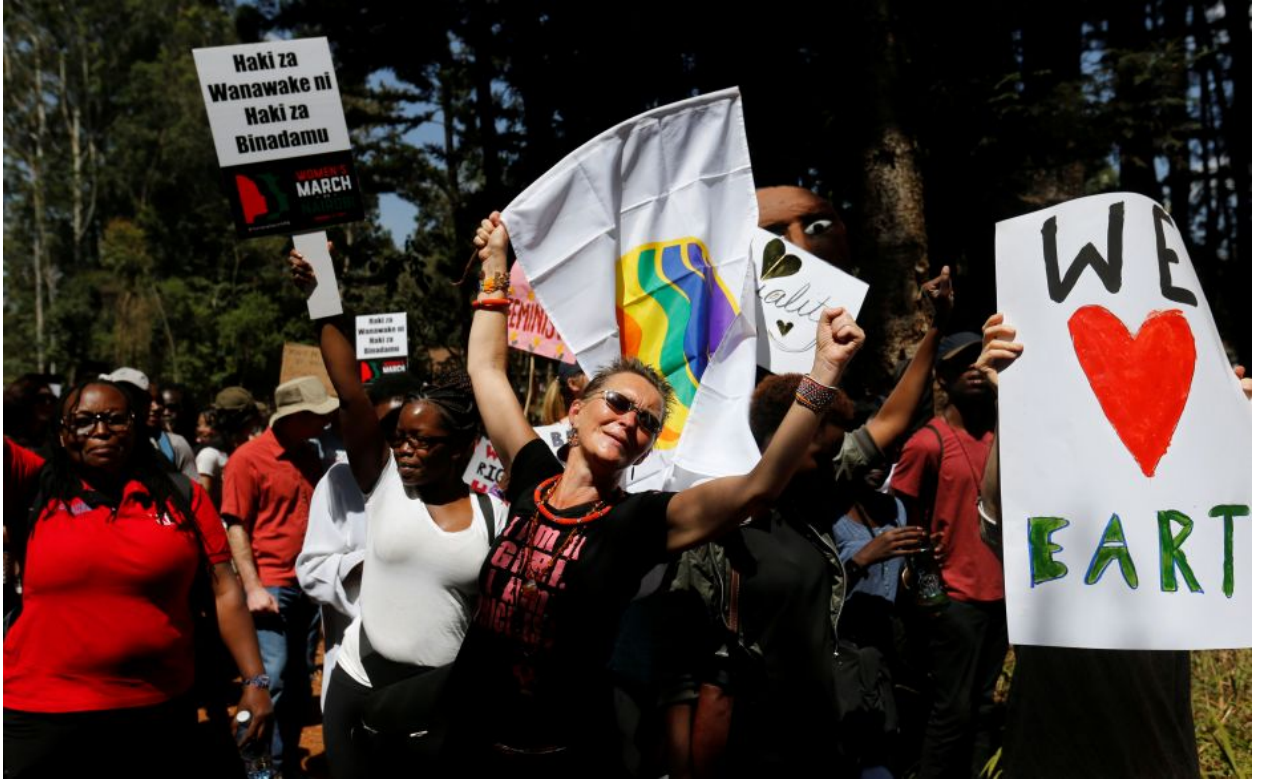
المتظاهرات يحملن لافتات مناهضة لترامب في مسيرة المرأة بالعاصمة الكينية نيروبي