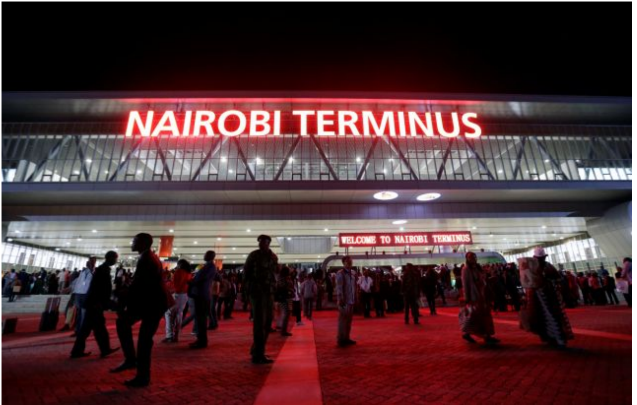
بناء خط سكة حديد جديد بواسطة شركة الجسور والطرق الصينية وبتنويل صيني