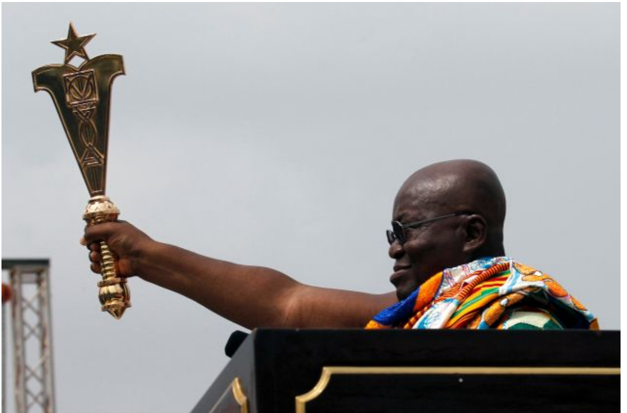
رئيس غانا الجديد في حفل اليمين بساحة الاستقلال في أكرا، غانا