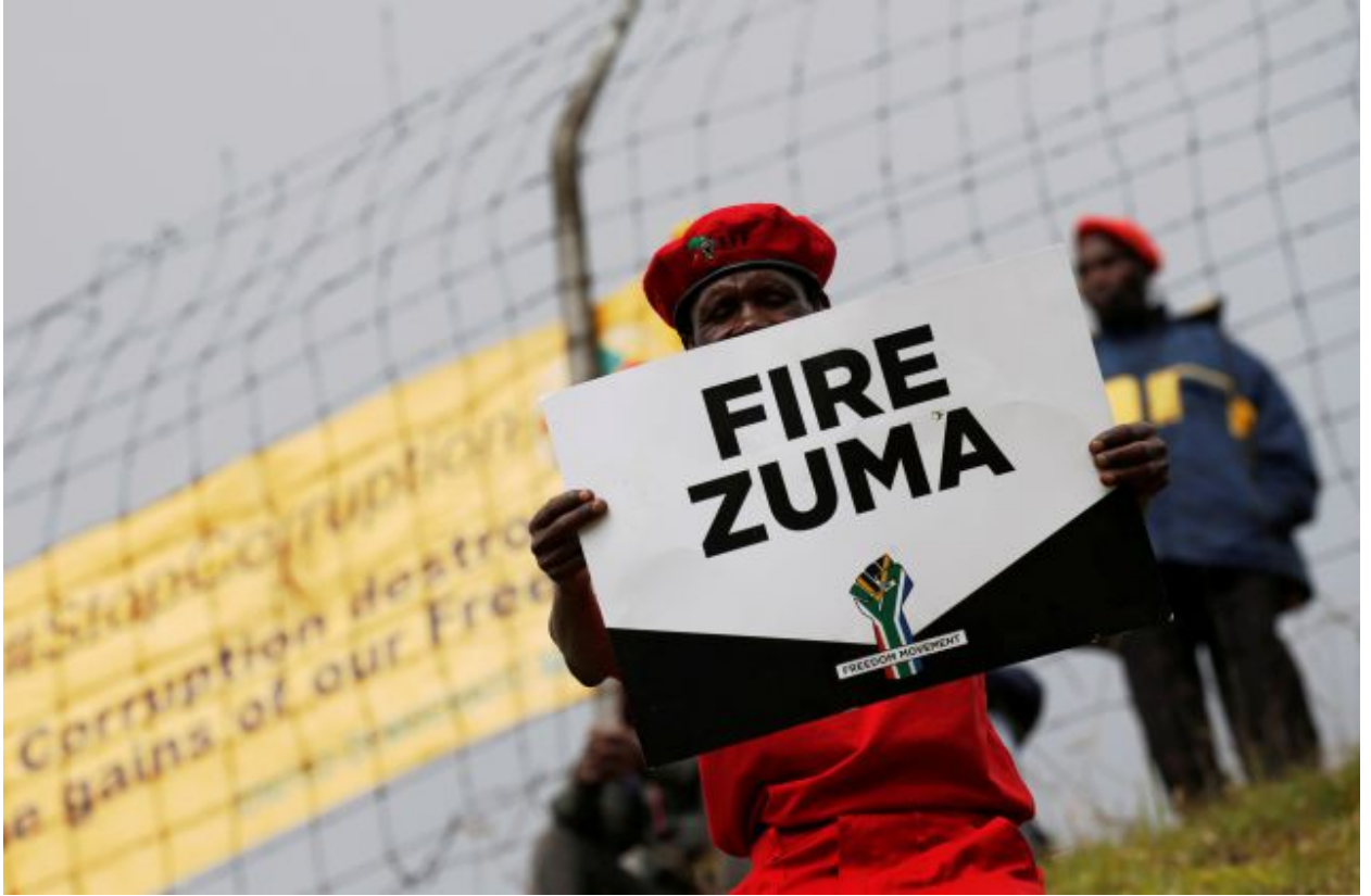
المعارضة تحمل لافتات لعزل الرئيس جاكوب زوما خارج المحكمة الدستورية في جوهانسبرغ