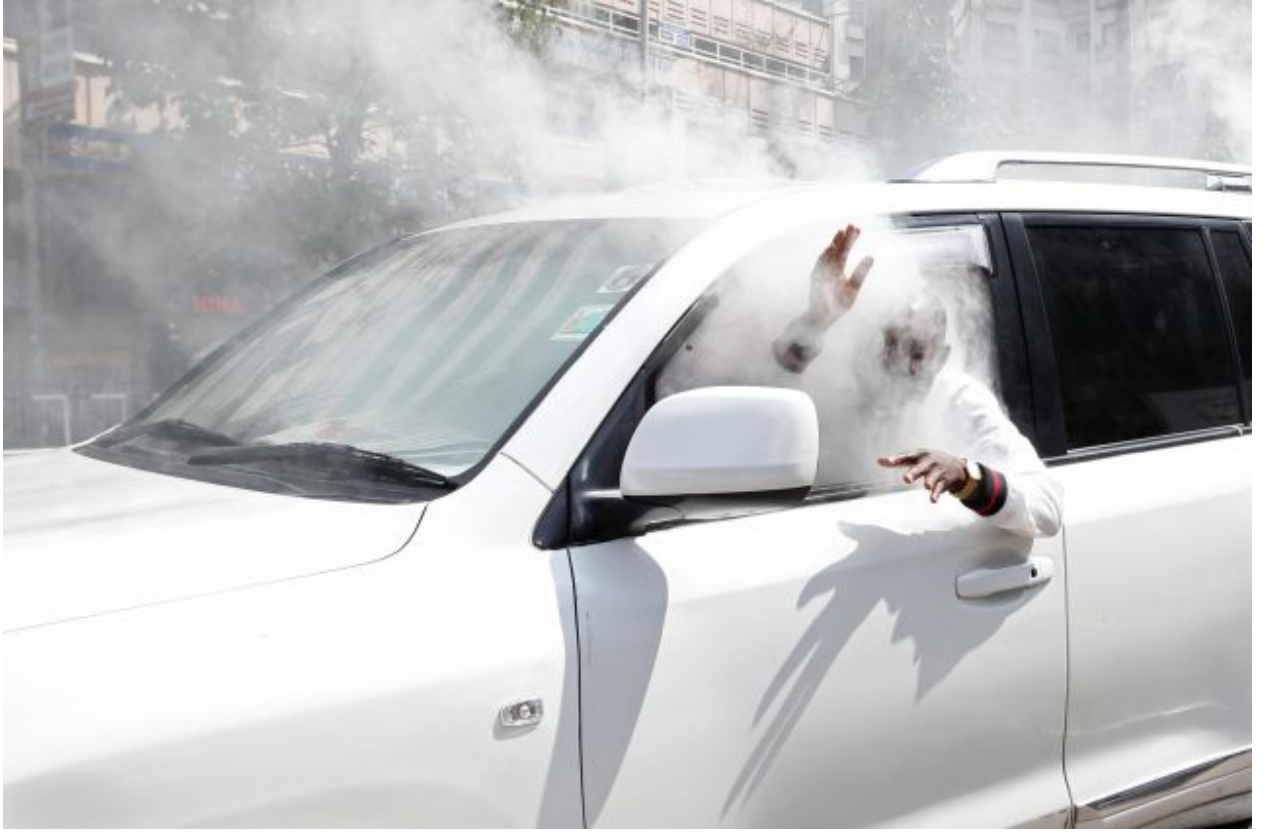
أحد المعارضين بعد إطلاق الشرطة الكينية النار على سيارته