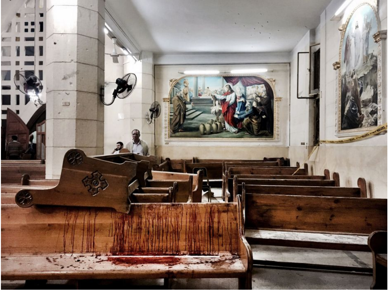
بقع من الدماء في كنيسة القديس جورج بمدينة طنطا في مصر