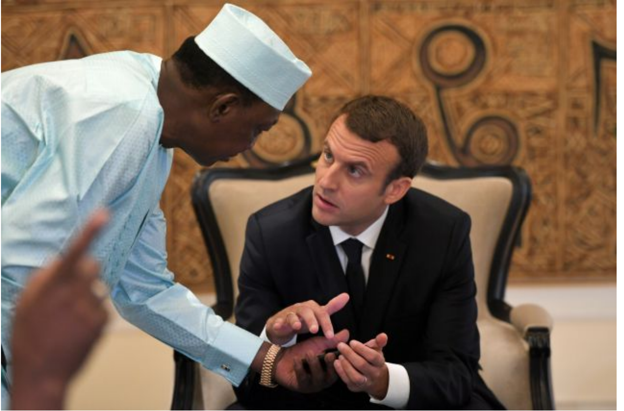
رئيس التشاد يتحدث مع إيمانويل ماكرون في قمة مجموعة ال5 في مالي