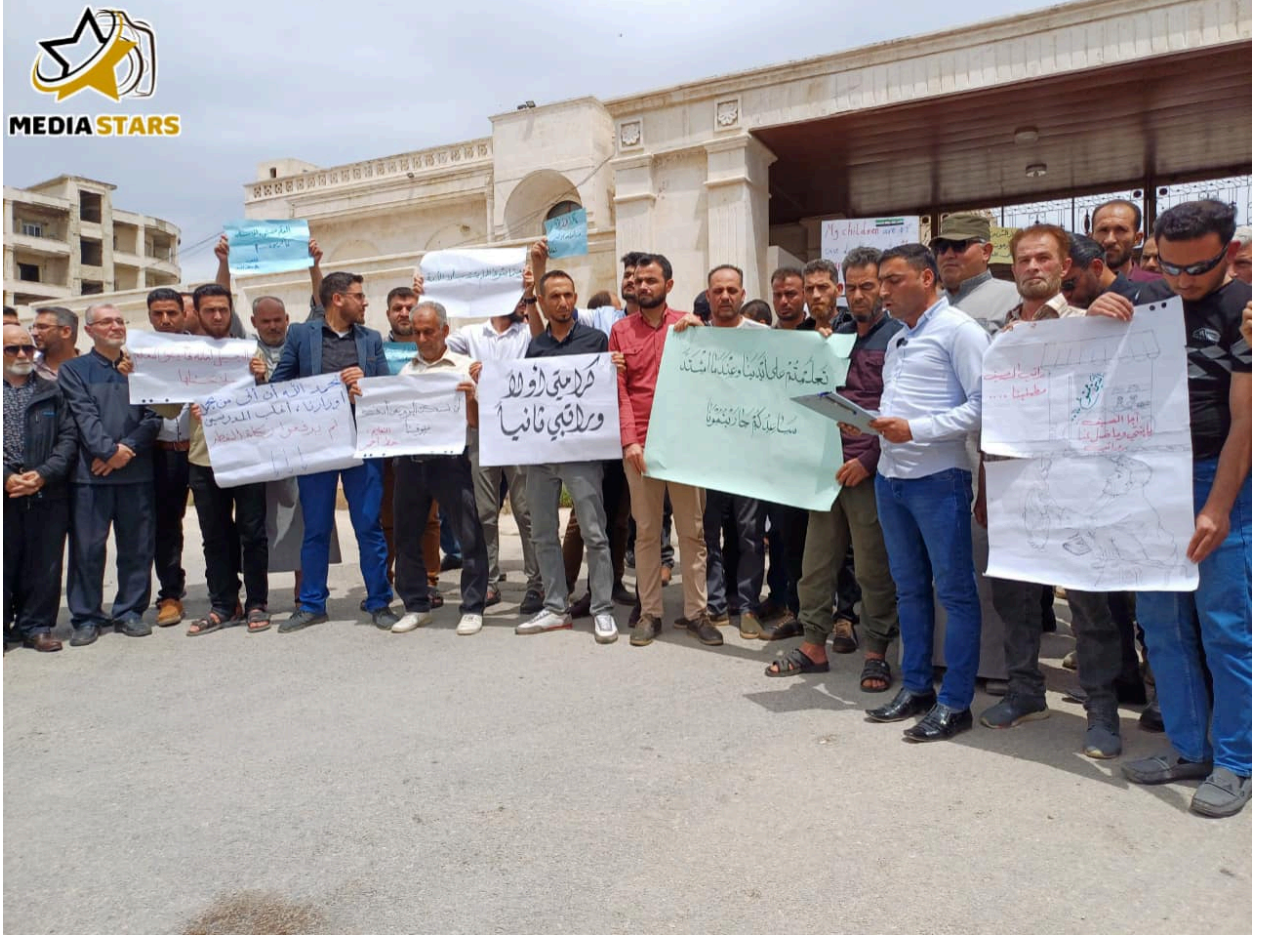
احتجاجات المعلمين أمام مبنى حكومة الإنقاذ في محافظة إدلب

في مدينة إدلب، رفعوا خلالها لافتات ومطالب تدعو إلى تحسين الرواتب وتنظيم العمل التعليمي ضمن القطاع العام، ومنحه الأولوية والاهتمام اللازم وسط محاولات خصخصة التعليم، إلا أنها لم تتلقَ ردًا من مسؤولي الحكومة.