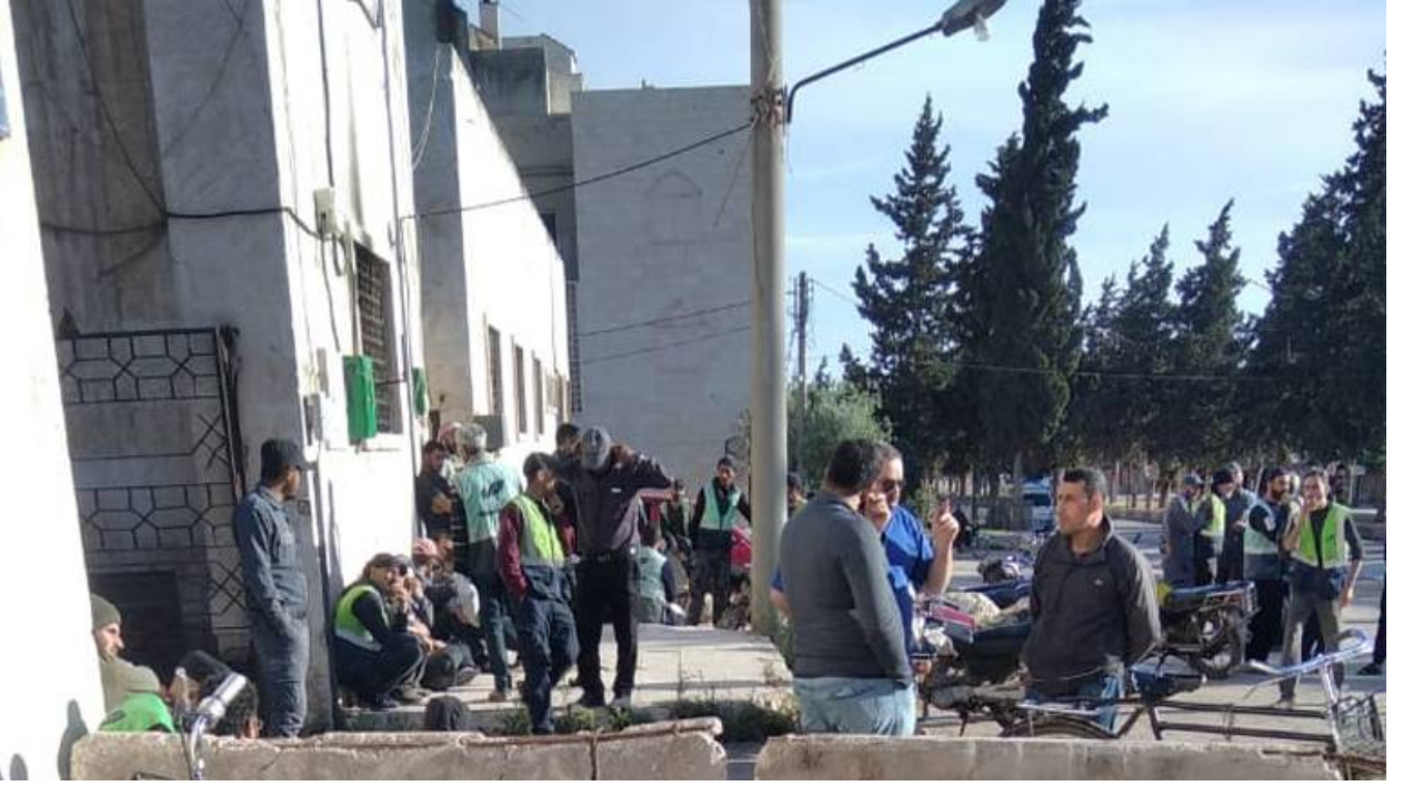
إضراب واحتجاجات لعمال النظافة في إدلب

كما نقذ عمال النظافة في مدينتي إدلب والدانا وقفة احتجاجية وإضرابًا عن العمل منتصف الأسبوع الماضي، احتجاجًا على سياسة شركة E-Clean وقوانينها الجائرة بحقهم، وطالبوا بزيادة الرواتب وإعطائهم إجازات أسوة بباقي العمال ومنح أسرهم تأمينات صحية، بعدما تدهورت أوضاعهم مع بدء عمل شركة E-Clean، والتي خفضت رواتبهم من 150 دولارًا إلى 104 دولارات.