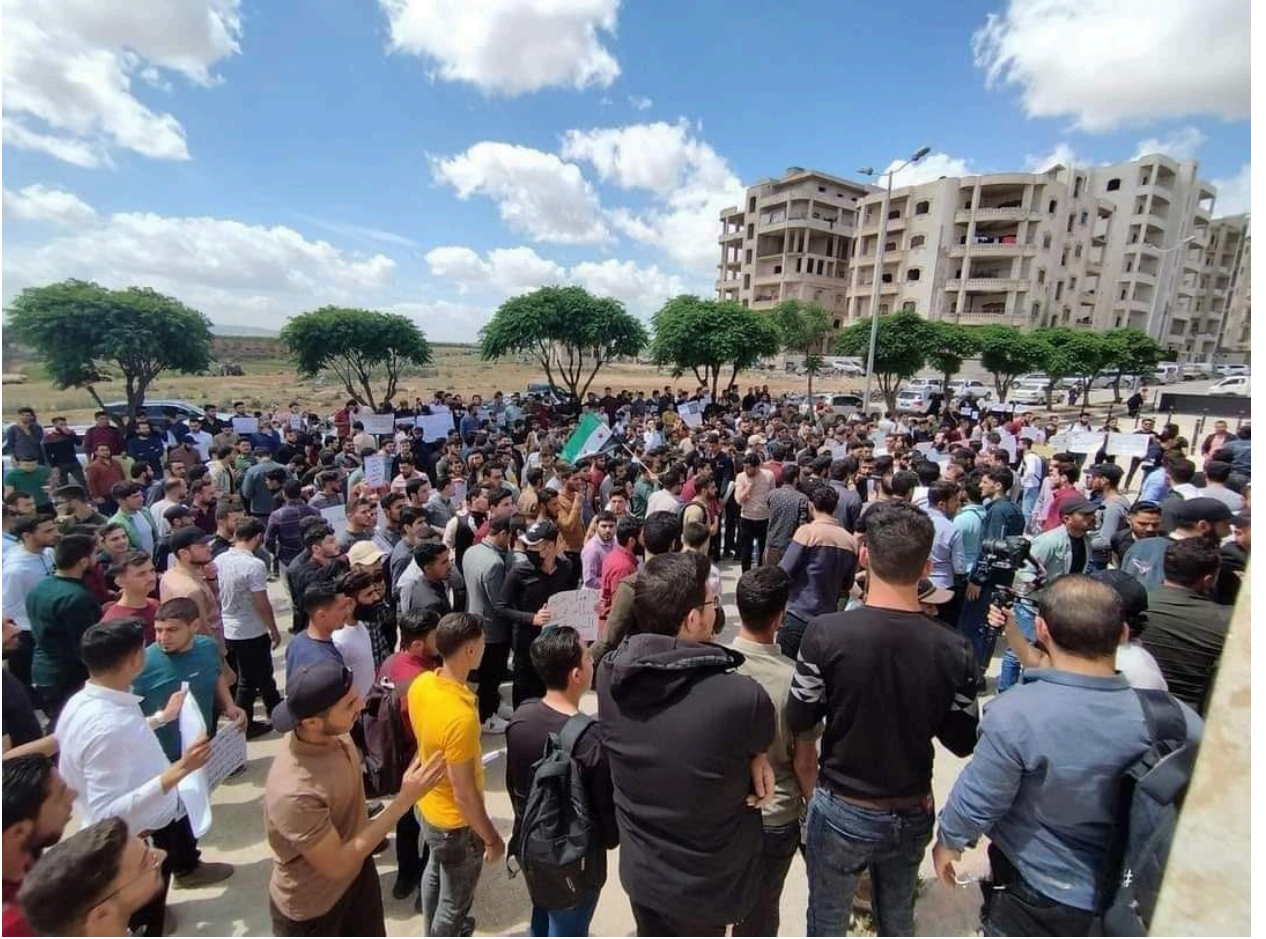
احتجاجات طلاب جامعة إدلب رفضاً لتعيين خريجي جامعات نظام الأسد

وفي السياق، نظم طلاب وطالبات جامعة إدلب وقفه احتجاجية في 4 مايو/ أيار الجاري أمام مبنى مجلس الوزراء في حكومة الإنقاذ، رفضاً لتعيين خريجي جامعات مناطق سيطرة نظام الأسد، حيث طالب المحتجون بتوقيف جميع الإجراءات المعادلة وتراخيص مزاولة المهنة المتعلقة بشهادات المتخرجين من جامعات نظام الأسد بعد عام 2016.