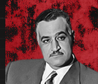
جمال عبد الناصر