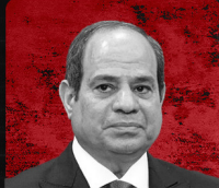
عبد الفتاح السيسي