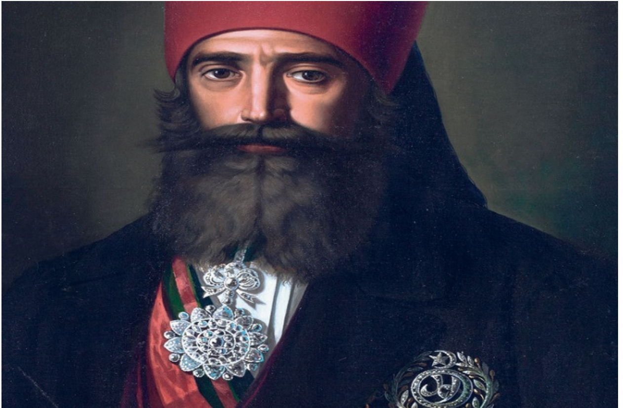
أحمدباي حاكم تونس

وفي تلك الفترة كان يوجد صنفان من العبيد في تونس، حيث وجدت فئة عرفت بالرقيق الأبيض، وتشمل في معظمها نساء وأطفال بيض البشرة وقع اختطافهم عن طريق القرصنة البحريّة، وكان عدد من أولئك النساء والأطفال يباع في سوق العبيد، ويفتدى قسم ثان منهم، فيما يلحق قسم ثالث للعمل بمؤسسة الحكم، وقد ارتقى عدد من الملحقين بالقصر إلى رتب عالية في الدولة كما أنجب عدد من البايات أطفالاً من جوارى مختطفات.