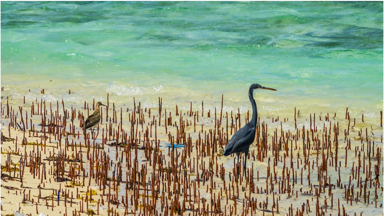
طائر بلشون الصخر يعيش على طول السواحل