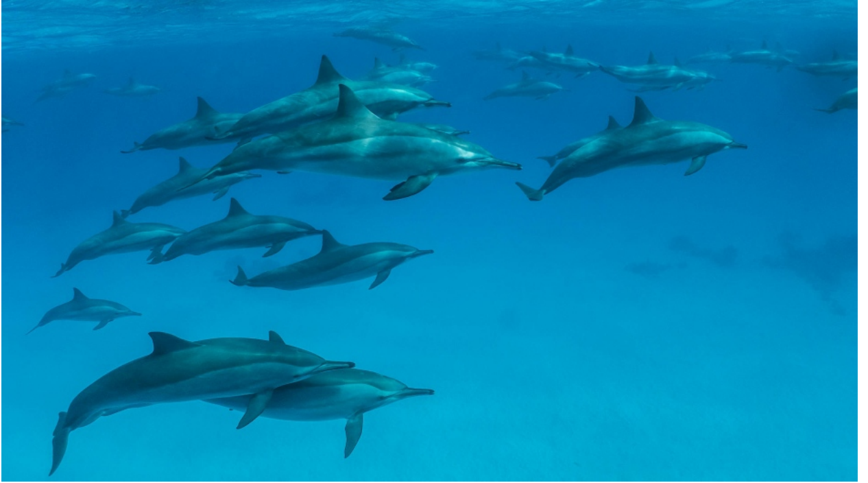
دلافين بيضاء المنقار تتجول أمام الشعب المرجانية