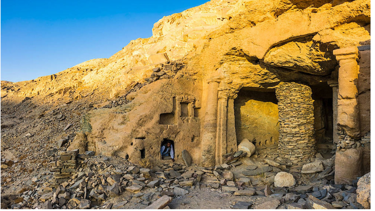
مدخل المعبد الكبير في وادي سيكايت، حيث رمم مجموعة من علماء الآثار بقايا الأعمدة الصخرية سنة 2006