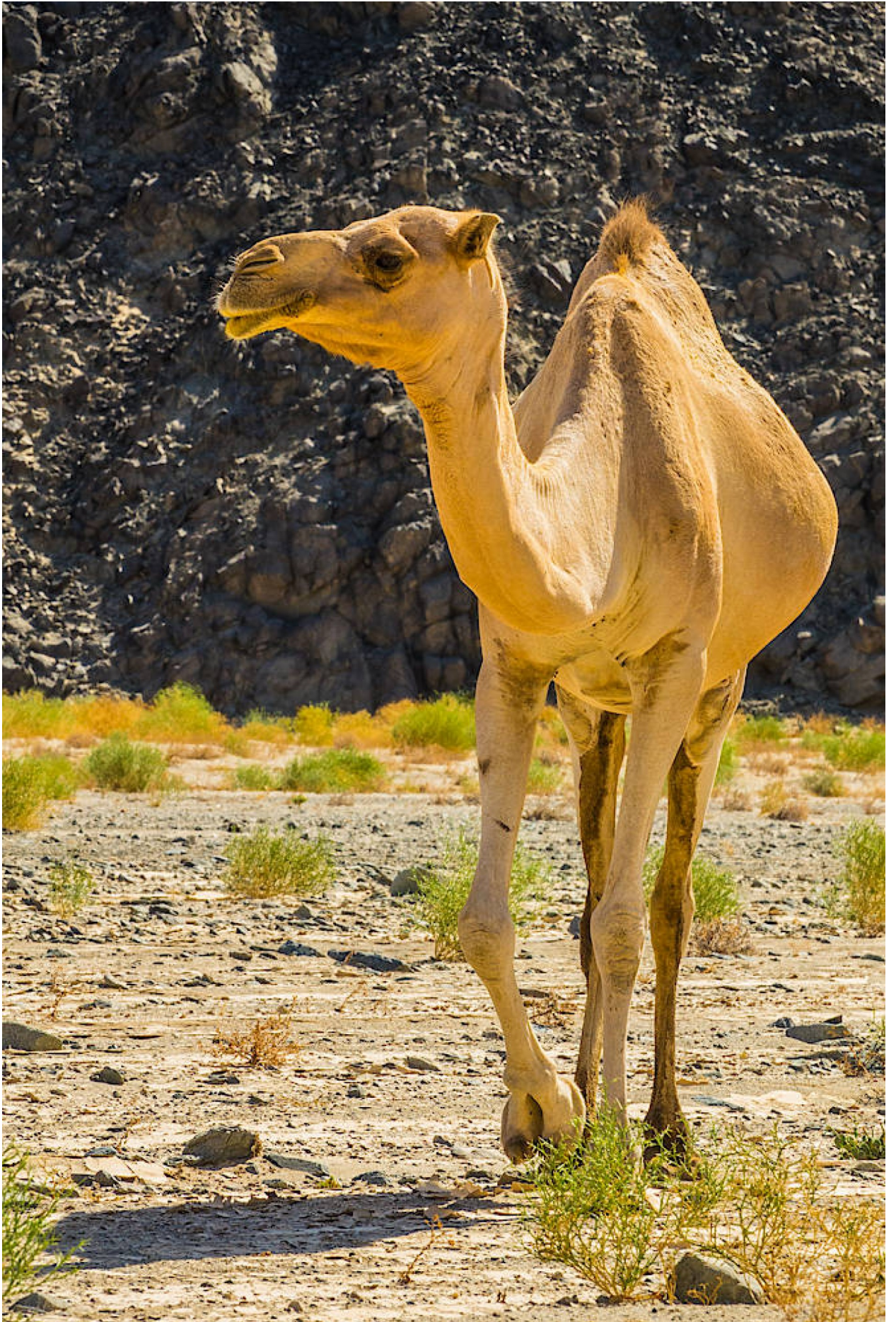
هذا الوادي خاص بالجمال