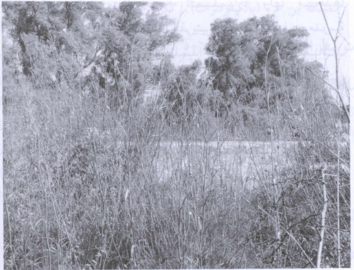
بقايا بناء مضخة المياه الخاصة بالقرية (حزيران/ يونيو ١٩٨٧) [السواوير الغربية]