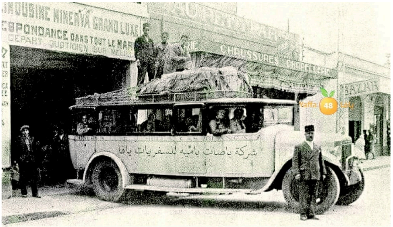
صورة لحافلة تابعة لشركة باصات بامية للسفريات التي كانت محطتها المركزية في النهضة خلف سوق الدرهي بيافا.

وهذا صحيح إلى حدٍ بعيد، وينسحب على كثير من قرى ريف غزة الساحلية - السهلية التي كان بعض ثوارها يضطرون للالتحاق بالثورة بعيدًا عن قراهم إلى جبال الخليل والرملة حيث معاقل الثورة والثوار في المناطق الجبلية في حينه.