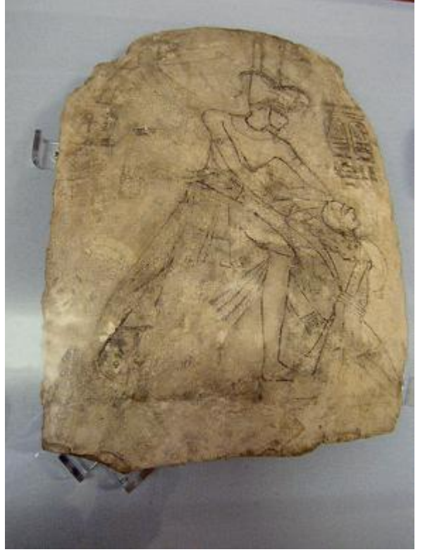
صورة للملك رمسيس في إحدى المعارك

لم تكن الشقفات خاصة فقط بالفن الهزلي للشعب المصري القديم، بل دون عليها كثير من جوانب الحياة في الحضارة الفرعونية، فكانت تصور الانتصارات في المعارك ، حيث نرى هنا في هذه اللوحة الملك محاولاً تحطيم رأس العدو الذي يمسكها بين يديه، كما يوجد نص مكتوب بالهيروغليفية يُفيد باسم الملك وهو هنا "رمسيس" وعبرة تقول "ملك الأرضين رمسيس، الملك الذي يسحق أرض الأعداء".