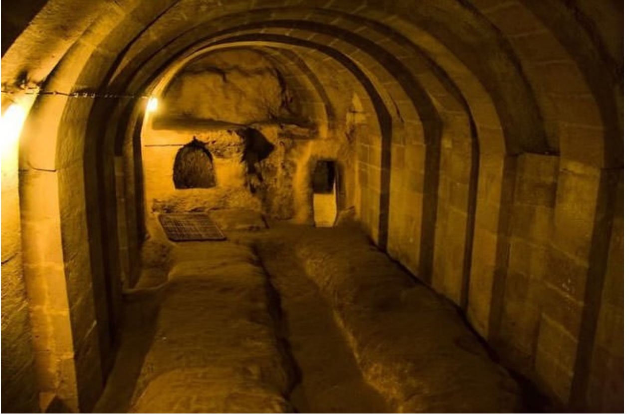
صورة من الغرف التي كانت توجد داخل المدينة

احتوت المدينة على أماكن مخصصة لتربية الحيوانات كذلك، حيث اكتشفوا أماكن مؤهلة لتكون مزارع لتربية الخراف والأبقار والطيور بمختلف أنواعها