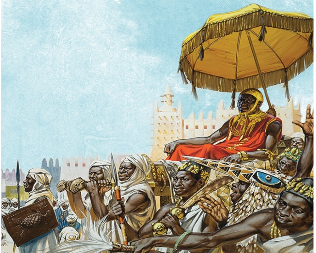
اشتهر مانسا موسى خلال حجة الذهب

رافق موسى خلال هذه الرحلة آلاف من الرجال والحاشية والخدم، حيث قطع الصحراء عن طريق ولاته وواحة توات ومن ثم اتجه إلى مصر، وقد كان ينشر الذهب حيثما حل وانطلقت يده بالعباء خصوصاً في الأماكن المقدسة حيث كان يوزع الهدايا دون توقف.