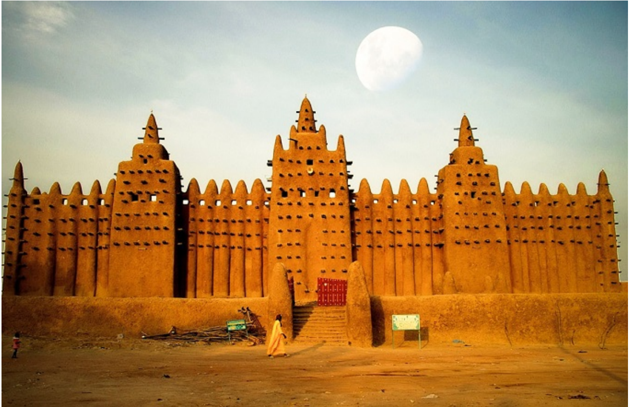
مثلت العاصمة تمبكتو قبلة العلماء من شتى البلدان الإسلامية

عند تأسيس الإمبراطورية، اختار سوندياتا كيتا عاصمة جديدة لها هي نيامي، وهي مدينة تقع غرب نهر النيجر، وليست بعيدة عن حدود غينيا الحديثة، ومع تطور الإمبراطورية وتوسعها تحولت العاصمة إلى مدينة تمبكتو التي سميت بـ"عاصمة الذهب"، حيث كان لا يوجد بها فقير وشيدت فيها المباني الضخمة والقصور.