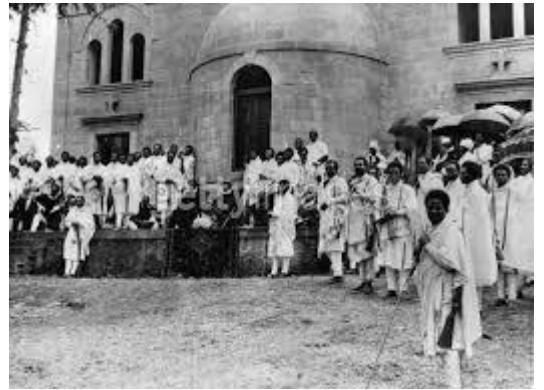
القوات الإيطالية في مدينة كسلا السودانية 1940

كما خضعت للاستعمار الإيطالي لعام واحد (1940) عندما احتلتها وحدة من قوات شرق إفريقيا الإيطالية التي كانت تسيطر على إريتريا، لكن سرعان ما عادت المدينة إلى سيطرة بريطانيا بعد انسحاب القوات الإيطالية تحت ضربات نظيرتها الإنجليزية.