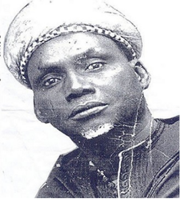
الشيخ عثمان دان فوديو

فمع أفول نجم الممالك الإسلامية هناك، كان البديل المائل هو النكوث عن الإسلام إلى الديانات التقليدية، وفي أحسن الفروض تكون المزوجة بين الإسلام وتلك الديانات هي الطريق إلى خلط يبقى من الإسلام اسمه ويمحو معاله وأثره، مثلما حصل في مناطق عدة من العالم.