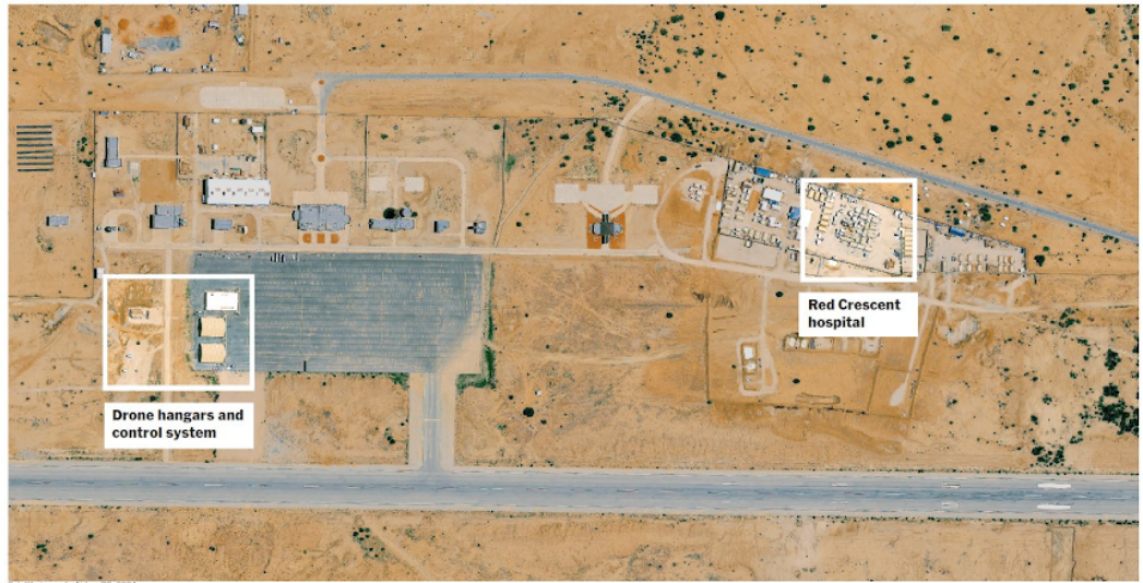
Drone hangars and control system

On a site 30 miles from Sudan, a field hospital and infrastructure for drones made for unusual neighbors.