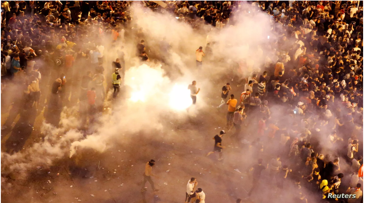
جانب من مظاهرات لبنان التي شهدت مصادمات عنيفة وحرق وتحطيم مبان ومحلات. 2019.

الأمر الذي تسبّب في سخط شعبي متزايد، وبتعبير حنين: “الفجوات الاقتصادية التي نجح حزب الله في سدها منذ ثمانينيات القرن العشرين عادت اليوم إلى الظهور بسبب الدور الإقليمي للحزب في سوريا”.