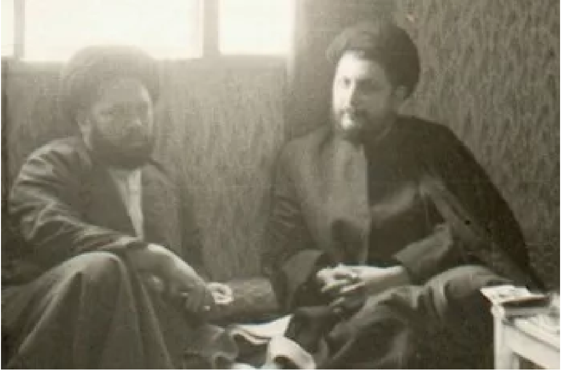
موسى الصدر ومُجد حسين فضل الله مجتمعين في منزل الأخير سنة 1968.

وحسب حنين، فعندما بدأ الرئيس فؤاد شهاب مبادراته التنموية في لبنان عام 1963، اكتشفت الحكومة أن من بين 452 بلدة وقرية في الجنوب -موطن 400 ألف نسمة- 250 بلدة وقرية ليس لديها إمكانية الوصول إلى المياه، و7 فقط لديها إمكانية الوصول إلى الكهرباء.