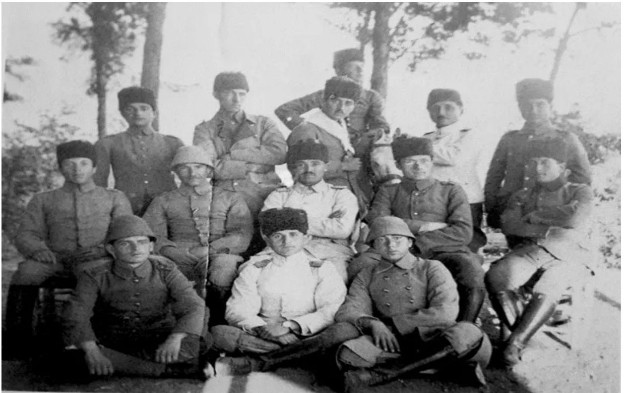
جنود عثمانيون في جبل لبنان عام 1914.

ويوضح سعدون أن النظرة العثمانية إلى الشيعة كانت وليدة أحداث عسكرية وسياسية، أكثر منها نتيجة تباين في الفقه أو الاجتهاد، فالحروب الصفوية وثورات القزلباش (بالتركية: Kızılbaş) على السلطنة العثمانية هي التي رسمت المنطلق الرئيسي للسياسة العثمانية نحو الشيعة بشكل عام.