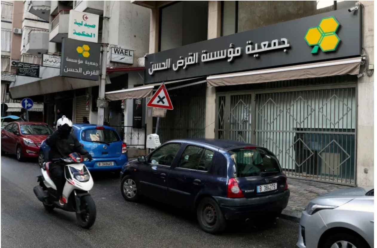
أحد فروع مؤسسة القرض الحسن في العاصمة اللبنانية بيروت.

يعتمد “حزب الله” على ما تسميه الكاتبة حينئذ “مثلث القوة”، وهو مثلث تحده ولاية الفقيه، والهوية الشيعية، والمساعدات والخدمات الاجتماعية التي يقدمها، وحسب حينئذ فإن الارتباط بين هذه النقاط الثلاث جعل من الصعب جدًّا على الشيعي أن يفصل هويته وتطلعاته السياسية عن أيديولوجية إيران وولاية الفقيه.