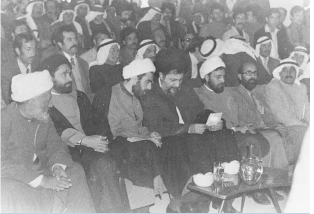
موسى الصدر بصحبة مصطفى شمران.

كان موسى ينتمي إلى الفرع الفارسي لآل الصدر من جبل عامل في لبنان، و درّيس علوم الدين في قم والنجف، ثم استقر في لبنان في وقت كان شباب الشيعة مغرمين بالأيديولوجيات الناصرية والبعثية والماركسية، ومع الوقت، ازداد بروز ونفوذ الصدر، و انكّب في سبعينيات القرن العشرين على توحيد الشيعة من خلال تكوين نواة حركة سياسية لتلبية احتياجات المجتمعات الشيعية الجنوبية.