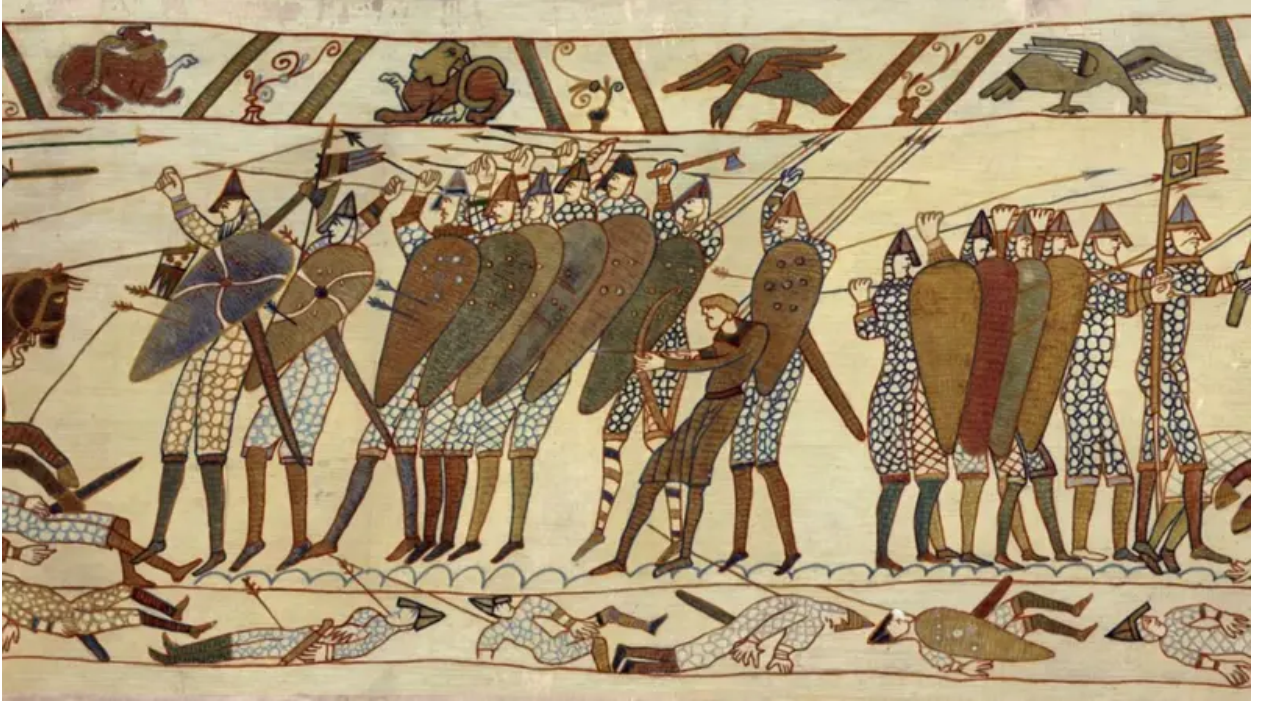
منسوجة بايو الأثرية التي تصف غزو النورمان لإنجلترا وتعود إلى القرن الحادي عشر.

اللافت هنا أن التهافت الأوروبي على أول توثيقٍ لإذلال العدو، والسعي المحموم لادعاء أبوته لا ينفصل عن الممارسات الاستعمارية المتواصلة للاحتلال الإسرائيلي في فلسطين، وذلك ضمن سلسلة من المحاولات لكسر كاريزما المقاتل حتى في آخر لحظاته، عبر إظهار كل مشاهد إذلال الأسرى والشهداء ونزع ستار الكرامة الإنسانية عنهم أحياءً أو أموات، والتنكيل بعائلاتهم وأطفالهم بهدفٍ واحد عنوانه: التأكيد على القوة الضاربة بما لا يترك في نفوس الآخرين سوى الخوف والرعب واليأس.