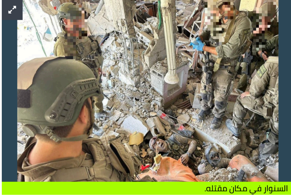
السنوار في مكان مقتله.

أخبار | الخميس 17 أكتوبر 2024 18:53 | «عكاظ» (جدة) @okaz_online | 6710 مشاهدة