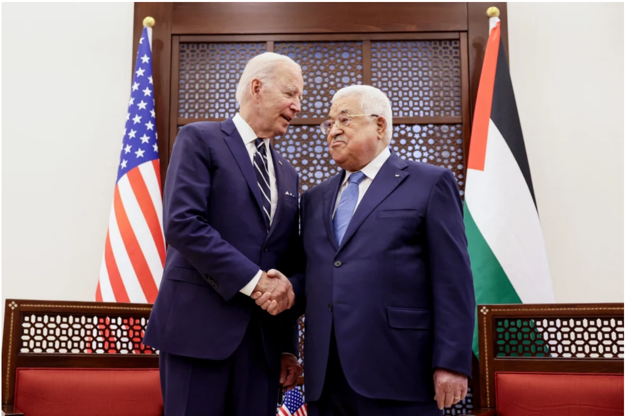
الرئيس جو بايدن مع الرئيس الفلسطيني محمود عباس في عام 2022

وقد صرح الرئيس ترامب حينها قائلاً: “من يتلقون ملايين الدولارات كمساعدات من الأمريكيين لن يحصلوا على شيء منها ما لم يجلسوا إلى طاولة المفاوضات”، وذلك بالتزامن مع نقل السفارة الأمريكية إلى مدينة القدس، في خطوة رمزية تعني ضم المدينة المقدسة لـ”إسرائيل” بموافقة أمريكية.