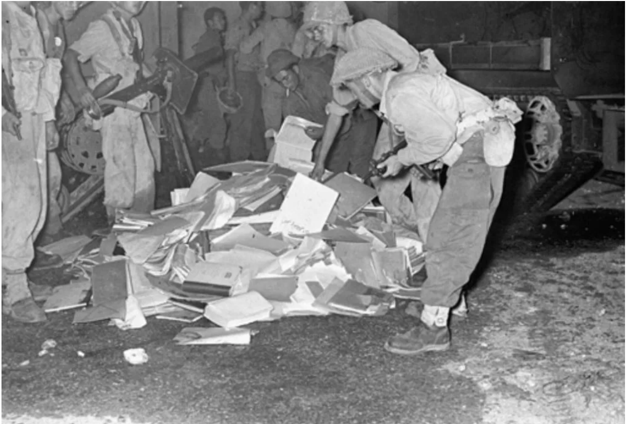
جنود إسرائيليون يستولون على وثائق في قلقيلية، عام 1956.

في عام 1868، حققت منظمة "إخوة العهد" أول اختراق لها في فلسطين العثمانية من خلال تعاونها مع الصليب الأحمر الأمريكي، حيث نجحت في جمع 4 آلاف و522 دولارًا لمساعدة ضحايا وباء الكوليرا. ومع مرور الوقت، توسعت أنشطتها في المنطقة العربية، فأنشأت محفلاً في القاهرة عام 1887 وآخر في القدس عام 1888 على يد إيلعازر بن يهودا، المعروف بـ "أبو اللغة العبرية الحديثة".