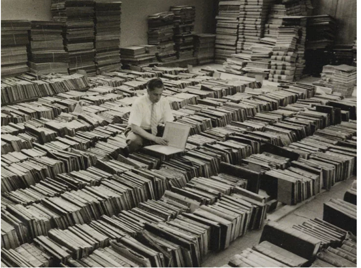
صور قديمة لعملية التصنيف في المكتبة الوطنية الإسرائيلية.

هذا التبرير للسرقة الثقافية يتماشى مع رأي المؤرخ الصهيوني إيلياهو أشتور، الذي وصف عملية الاستيلاء على الكتب بأنها "جمع وحفظ لها من التلف"، معتبرًا أن إخراجها من ملكية أصحابها الفلسطينيين كان بمثابة "تحرير" لتلك الكتب، حيث انتقلت إلى أيدي آخرين "يعرفون الاستفادة منها في مصلحة العلم والإنسانية".