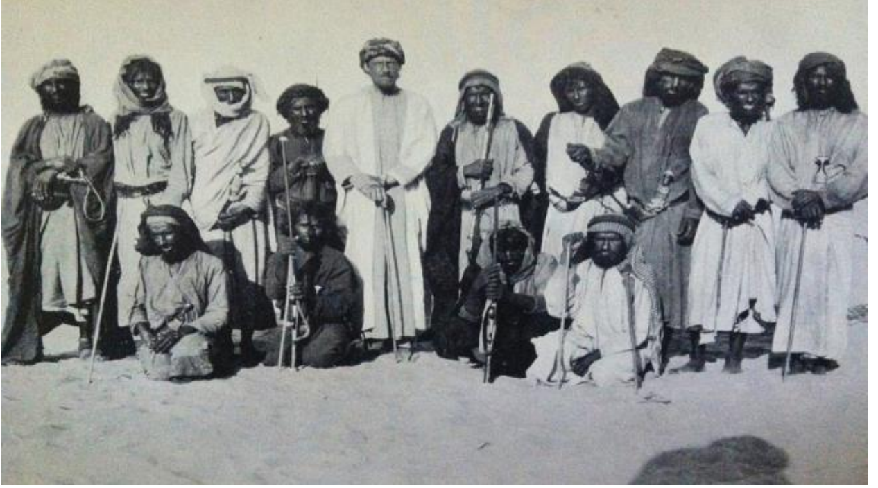
صورة للبدو من ألبوم رحلة برترام توماس

عرف توماس أنه لن يحصل أبدًا على إذن رسمي لرحلته الرائدة فغادر سرًا، وكانت تلك خطوة جريئة أتت ثمارها بعدما قطع مسافة تعدت الألف كيلومتر من الصحراء الحارقة.