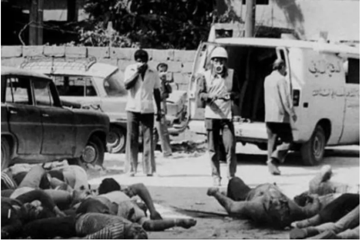
حملة سوريا 1982

ووفقًا لمنظمة العفو الدولية فإن النظام السوري البائد أدخل حاويات “غاز السيانيد” إلى المدينة، وتم ربطها بأنايب مطاطية بمدخل المباني التي اعتقد أنها تؤوي المتمردين، ثم تم تشغيلها، ما أدى إلى مقتل كل من بداخل هذه المباني. بجانب أن جنود النظام سرقوا محتويات منازل أهل حماة وممتلكاتهم التجارية وبيعت في أسواق خاصة.