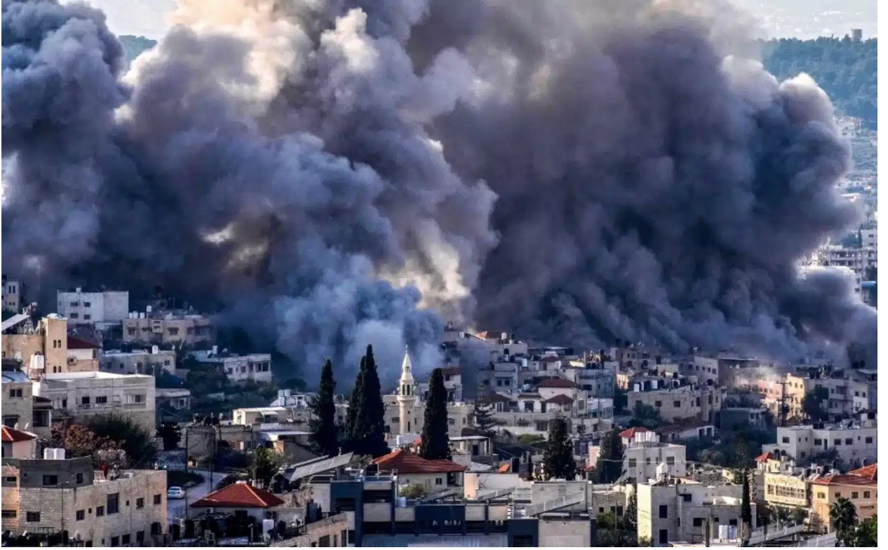
تصاعد الدخان من مخيم جنين للاجئين عقب غارة إسرائيلية في 2 شباط/ فبراير 2025

وفي تموز/ يوليو الماضي، قضت محكمة العدل الدولية بأن الوجود الإسرائيلي والإجراءات المتخذة في الضفة الغربية، التي تحتلها إسرائيل منذ عام 1967، غير قانونية ويجب إنهاؤها في أقرب وقت ممكن.