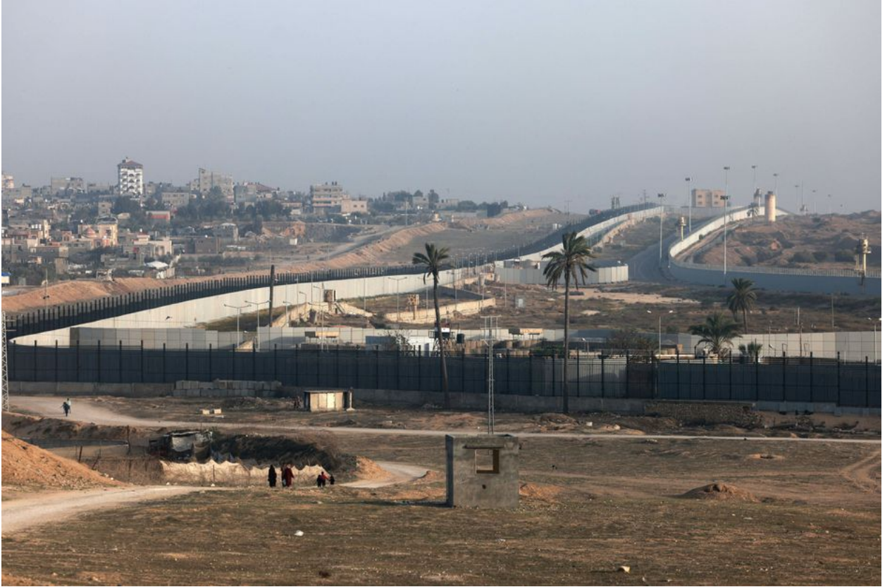
الحدود بين مصر وجنوب قطاع غزة.