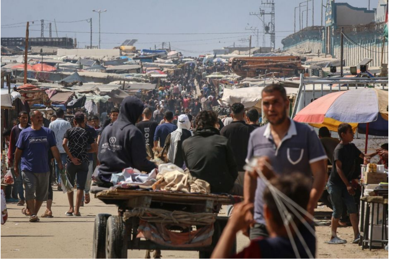
داخل أحد مخيمات الفلسطينيين النازحين في رفح.

يؤكد هذا المشهد أن إعلان الاحتلال لم يكن مجرد إجراء عسكري متدحرج وفقاً لمسار التفاوض، بل جاء تتويجاً لخطة طويلة الأمد تستهدف منع سكان رفح من العودة إليها، وتفريغ المدينة بالكامل من محتواها السكاني والعمري.