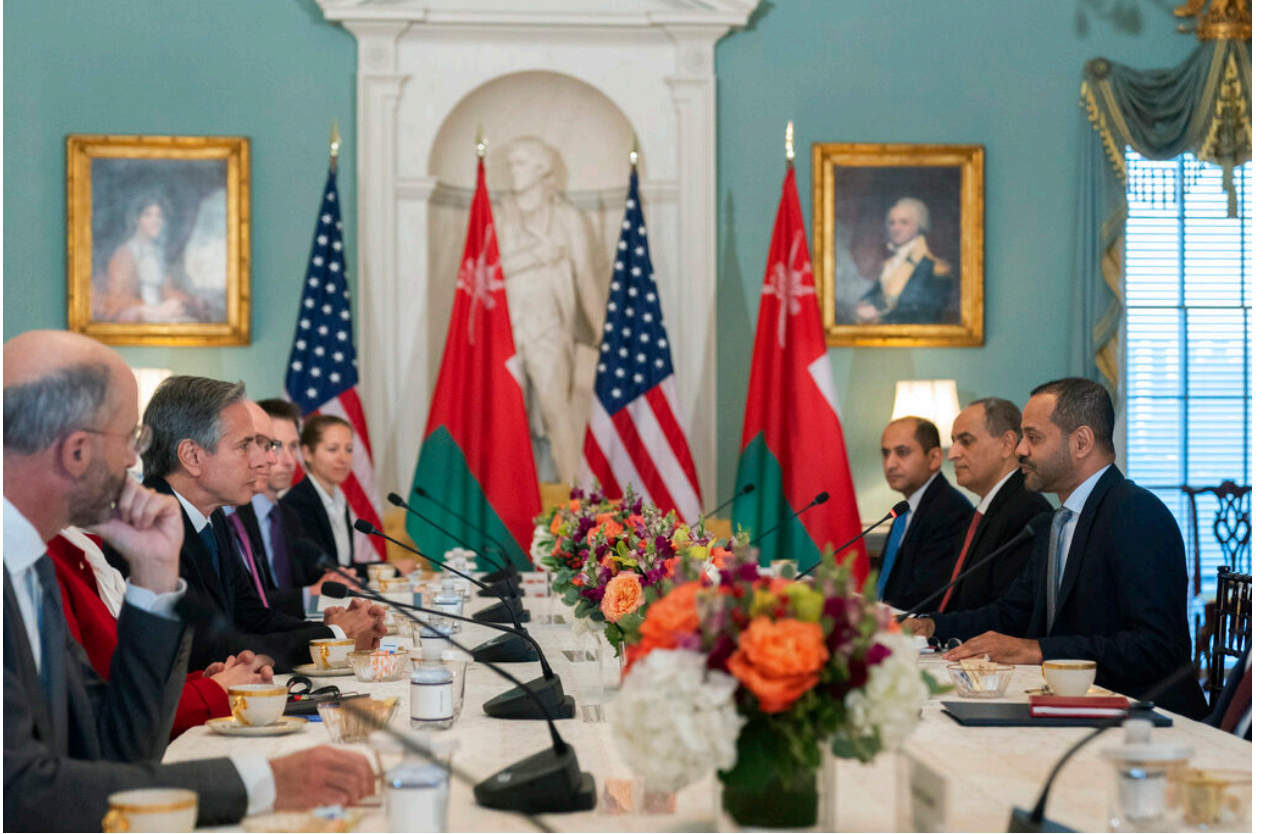
اجتماع بين وفدين من وزارة الخارجية الأميركية والخارجية العُمانية، نوفمبر 2022، في واشنطن العاصمة.

لقد منح نجاح عُمان في تقريب وجهات النظر بين واشنطن وطهران إبان عهد الرئيس الأمريكي السابق، باراك أوباما، وما انتهى إليه من توقيع الاتفاق النووي في العام 2015، ثقلًا دبلوماسيًا نادرًا للدور العُماني، ورشّح صورة السلطنة كساحة تفاوضية مرنة لا تُثير الحساسية لدى الأطراف المتنازعة.