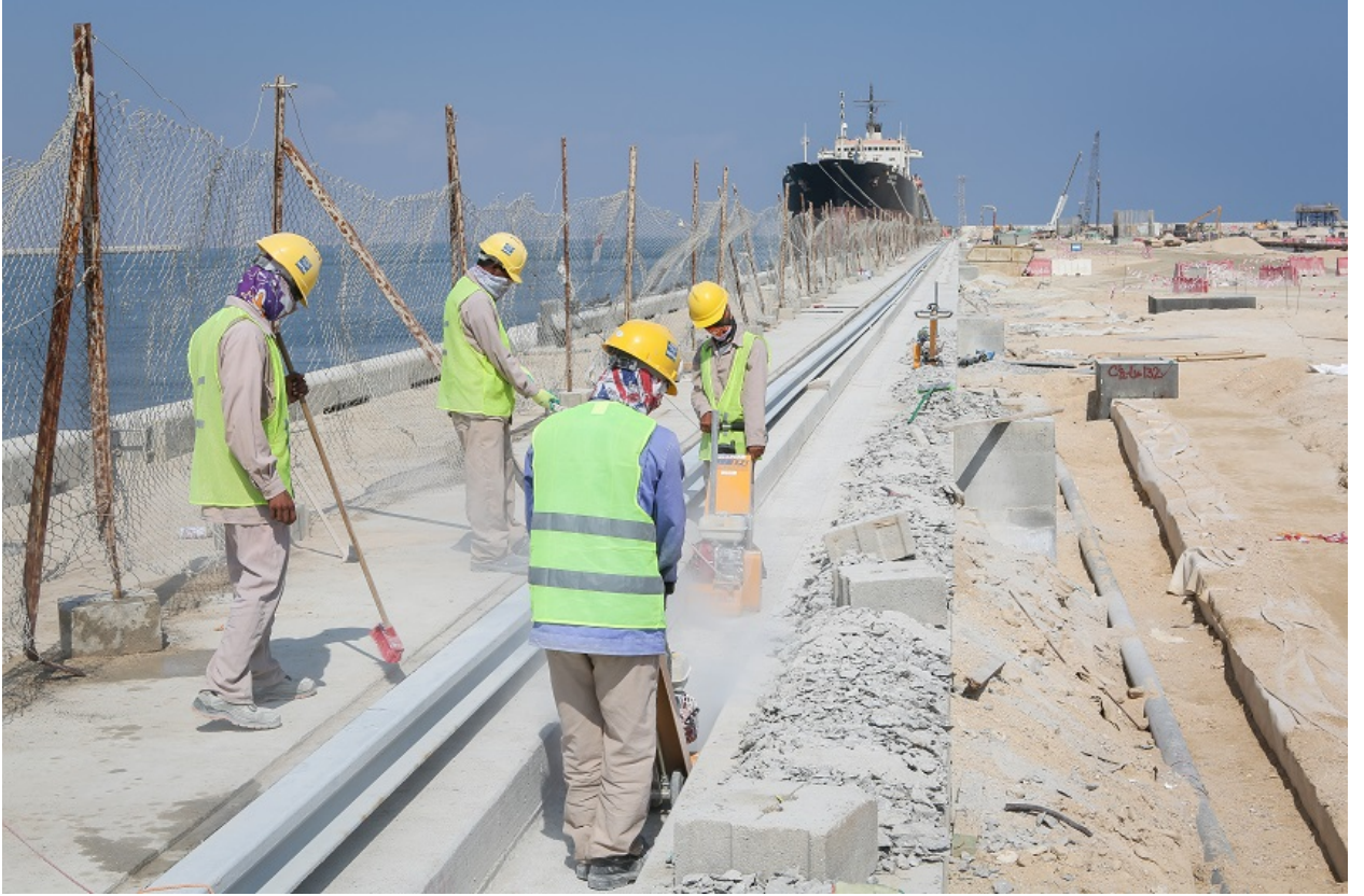
مجموعة من العمال الأجانب يؤدون عملهم في ميناء الدقم، عمان.

شكّلت اتفاقية "الوصول إلى المنشآت العسكرية" الموقعة في العام 1980 نقطة تحول في علاقة البلدين ، إذ باتت القواعد والمطارات العُمانية مثل مصيرة وثمريت ومسقط تحت تصرّف القوات الأمريكية وفق ترتيبات مسبقة، في إطار دعم عمليات الانتشار الأميركي في الشرق الأوسط، سواء في أفغانستان أو الخليج.