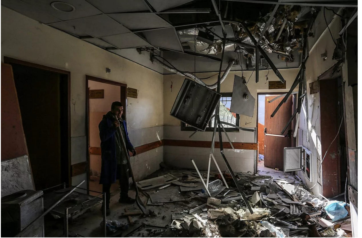
فلسطينيون في موقع الغارة الجوية الإسرائيلية على قسم الجراحة في مستشفى ناصر في خان يونس جنوب قطاع غزة، في 24 مارس/ آذار 2025.

في الواقع، لم يكن قصف المستشفى هو الحدث الأكثر دراماتيكية الذي يشهده فيروز خلال زيارته الأخيرة. قبل ذلك بأيام قليلة، في 18 مارس/ آذار، نفذت إسرائيل ما عُرف بـ “مجزرة رمضان” ؛ حيث قصفت من الجو نحو 100 موقع في وقت واحد أثناء وجبة السحور، مما أدى إلى مقتل أكثر من 400 فلسطيني، منهم 174 طفلاً.