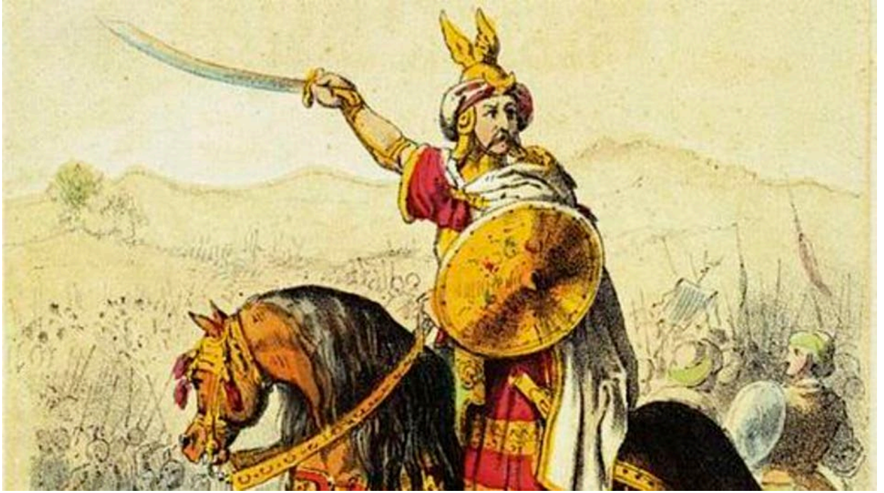
طارق بن زياد

لكن عبد العزيز السالم يرى أنه "ليس من المنطقي أن نربط بين طريف صاحب الحملة الاستطلاعية إلى الأندلس، وطريف مؤسس دولة بورغواطة الذي ظهر كحاكم سياسي فيما يقرب من عام 127 هجرية، لجرد اشتراكهما في نفس الاسم"، مضيئاً "فقد يتفق أكثر من شخص في حمل اسم طريف في فترة زمنية متعاصرة أو متقاربة، وليس بالضرورة أن ينفرد شخص واحد بحمل اسم طريف خلال فترة زمنية تبلغ نحو ثلث القرن"، بالتالي يخلص الباحث إلى أن طريف اسم لشخصين مختلفين.