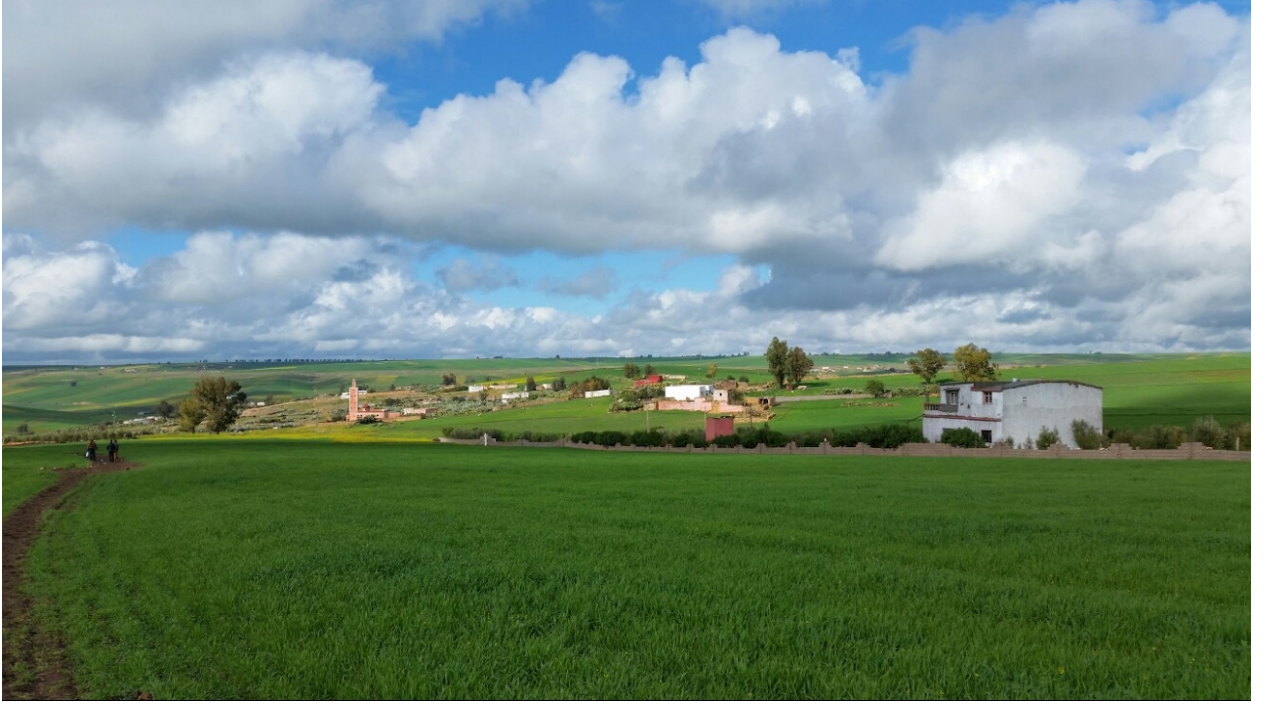
سهول منطقة الشاوية

كانت أرضًا غنية فلاحياً وما زالت كذلك، ومعبرًا للطرق التجارية البرية من شمال المغرب إلى جنوبه، الشيء الذي وقّر الدعائم الأساسية للحكام الذين تربعوا على عرش بورغواطية، وجعلها هدفًا للطامعين من الأعداء والإمارات المجاورة وحتى من القبائل والأفراد، فكانت أولى المواجهات مع دولة الأدارسة عهد المولى الإدريس الأول ونجده الإدريس الثاني، لأنهم اعتبروا سكان هذه الإمارة مجوسًا وحقّ فيهم الجهاد من أجل ضمهم إلى الإسلام، لكن غاراتهم المتوالية فشلت في تحقيق هدفها المنشود.