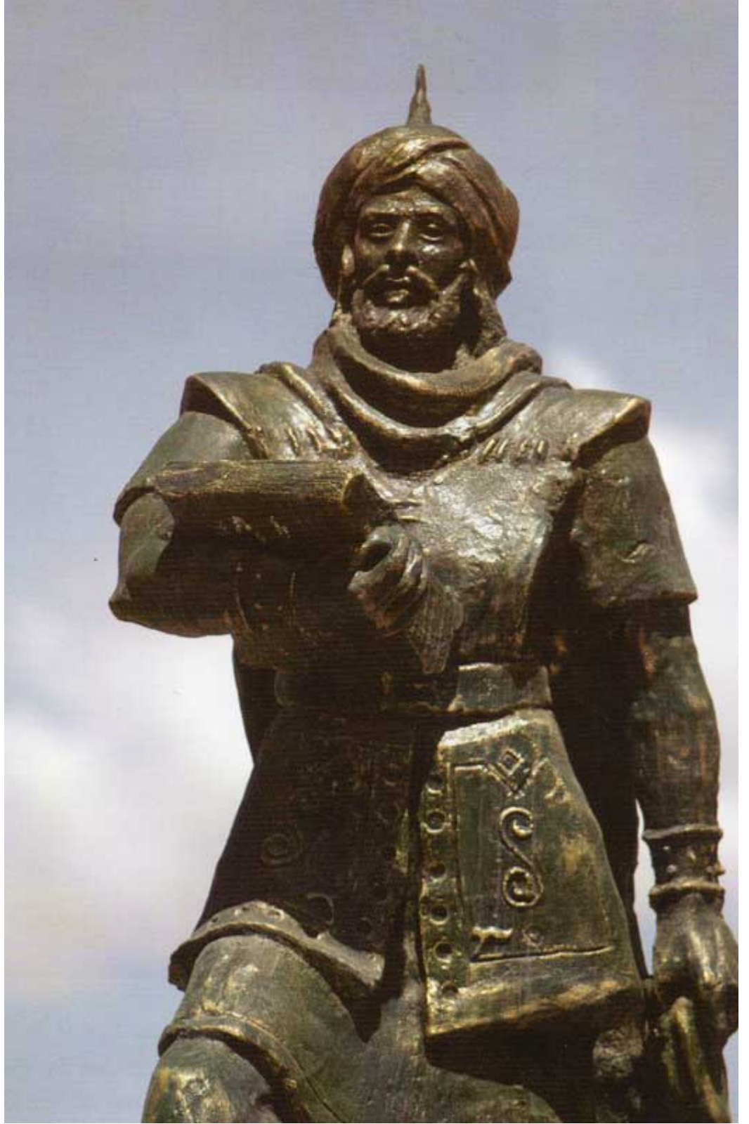
تمثال عقبة بن نافع في الجزائر

اختلف المؤرخون كثيرًا في تحديد طبيعة كيان بورغواطة في العصر الإسلامي، وتوضيح ما إذا كانت مجرد قبيلة عظمى من القبائل الأمازيغية أم دولة تحتفظ بكل خصائص الدول المستقلة؟ وتشير الظروف المحيطة ببورغواطة إلى أنها قبيلة أتاحت لها الظروف أن تصبح دولة قوية مستقلة، حافظ أبنائها على الاستقلال بفضل ثروتها الاقتصادية الهائلة وإمكاناتها العسكرية الوفيرة وقدرات أهلها