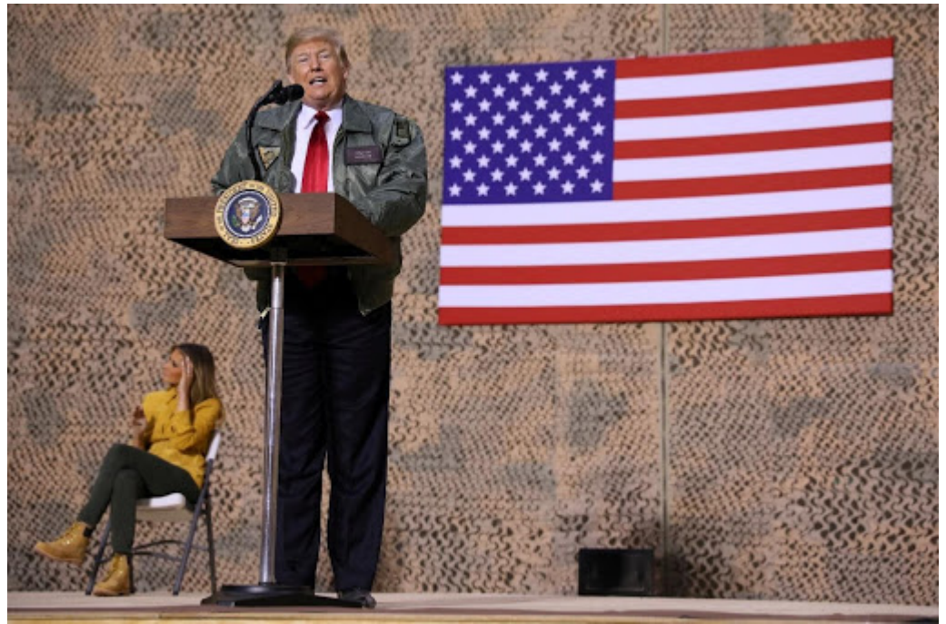
ترامب خلال زيارته لقاعدة عين الأسد بمحافظة الأنبار عام 2018

في شمال العراق تحتفظ الولايات المتحدة بثلاث قواعد عسكرية، إذ توجد في أربيل قاعدة عسكرية داخل مطارها الدولي، وقاعدة الحرير الجوية في أربيل أيضًا، أما في كركوك فتوجد قاعدة K1، فضلًا عن قاعدة القيارة جنوب محافظة نينوى.