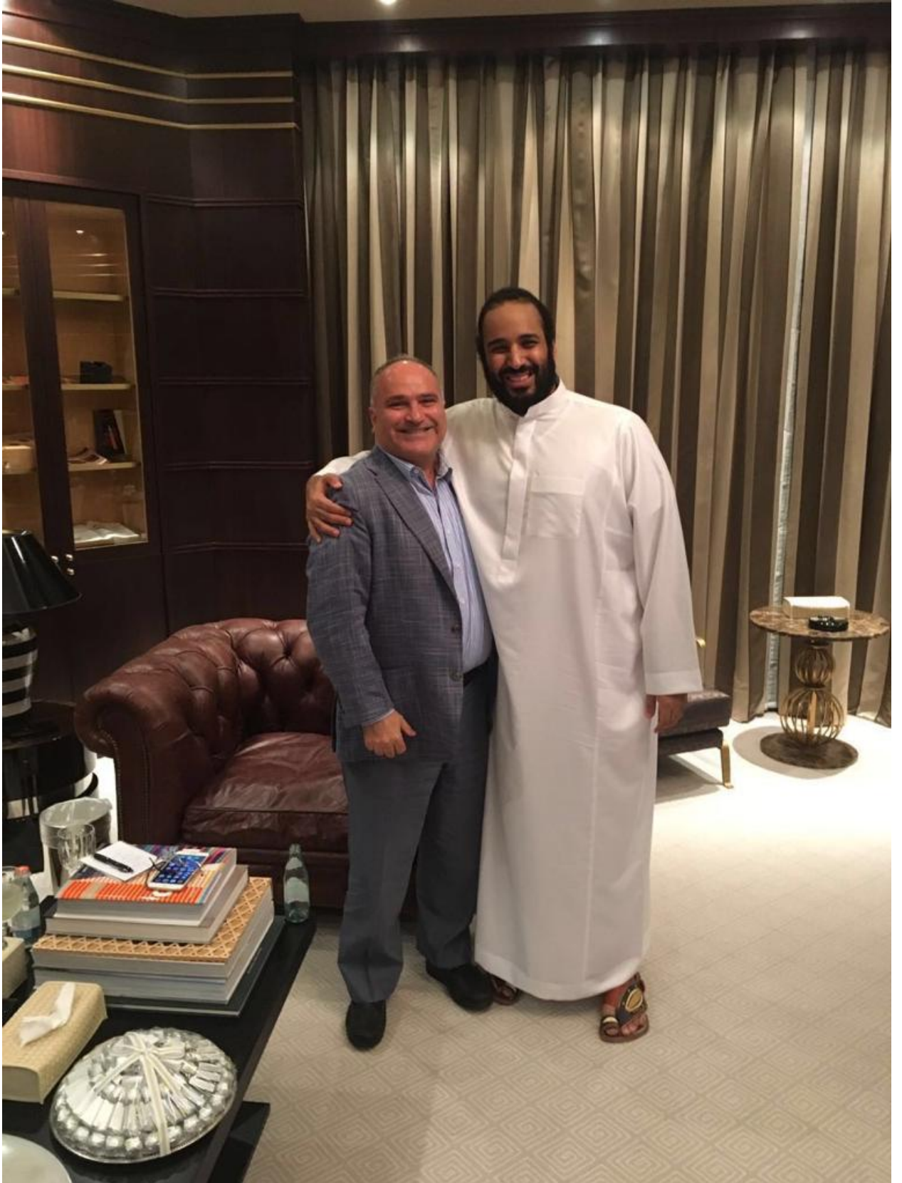
جورج نادر برفقة محمد بن سلمان.