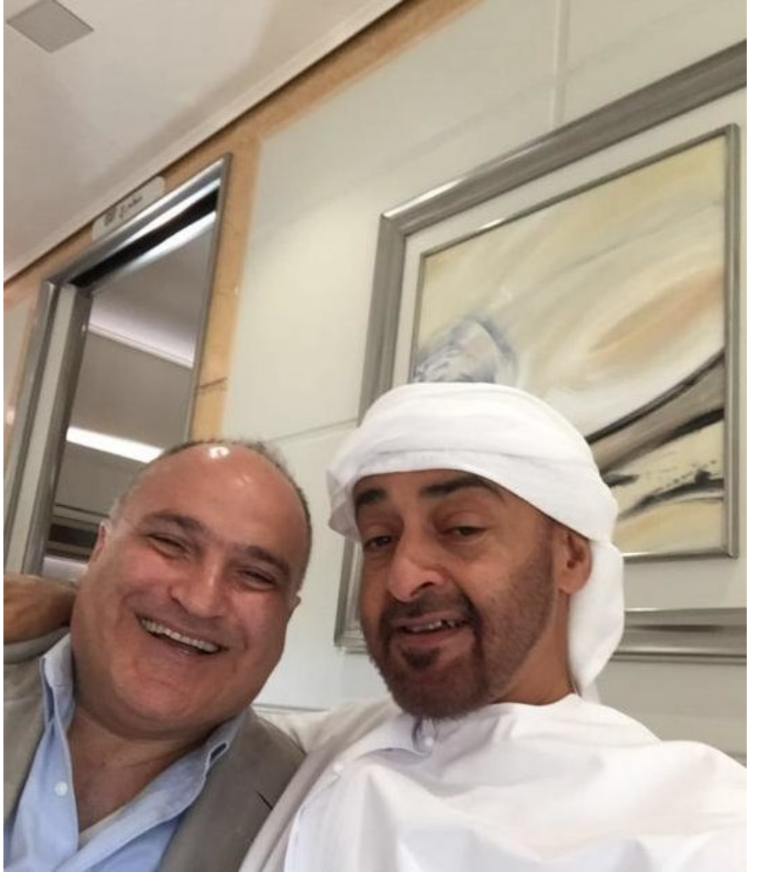
جورج نادر بصحبة محمد بن زايد.

لا تثبت هذه الصور وجود مخطط لتمويل حملة ترامب بشكل سري، لكنهم أظهروا أن نادر قادر على مقابلة كبار الزعماء كما قال. في مطعم السمك في بيروت، تشبث خواجه بيدي وانحنى إلى الأمام، مقلداً نادر، بصوت منقطع الأنفاس: "قال لي نادر 'إذا نجح الأمر'. ودفعتني خواجه نحوه - ' إذا نجح هذا الأمر، والله أندي، والله أندي، والله أندي، والله أندي... ' ". في هذه الأثناء صرنا أنا وخواجه قريبان بشكل غير مريح. إنه يقلد اللحظة الحاسمة مع نادر: "والله، أقسم بالله، أندي، صاحب السمو سوف يسيطر على كل انتخابات أمريكية. سوف يتحكم صاحب السمو بالولايات المتحدة، سوف نتحكم بالولايات المتحدة".