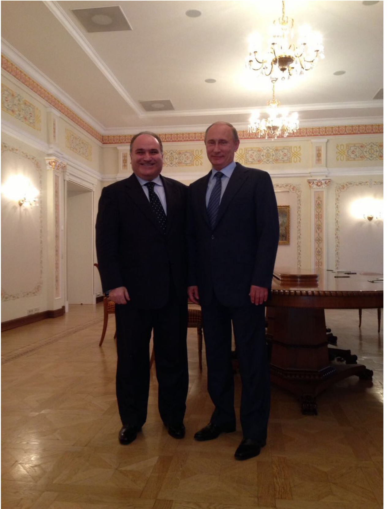
جورج نادر بصحبة فلاديمير بوتين.