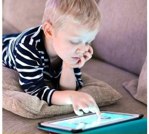
في منزل الجدة

عادة ما تميل الجدات إلى تدليل أحفادهن. فعلى سبيل المثال، يدرك الطفل الذي ينمو بين أفراد أسرته المصغرة أن كل فرد يقوم بغسل الصحن الذي يأكل فيه بنفسه بعد تناول وجبة العشاء. على العكس من ذلك، قد يفهم الطفل الذي يعيش عند جدته بأن هذا الأمر ليس ضرورياً لأن الجدة تقوم بمفردها بغسل كافة الصحنون. هنا، يشعر الطفل بشيء من التضارب والتناقض حيث أن الأشخاص الذين يلعبون دوراً مهماً في حياته يطلبون منه القيام بأشياء مختلفة تماماً.