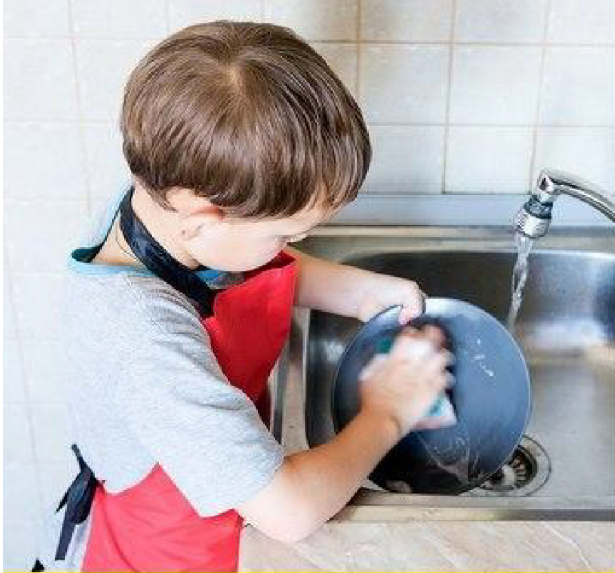
في منزل الآباء