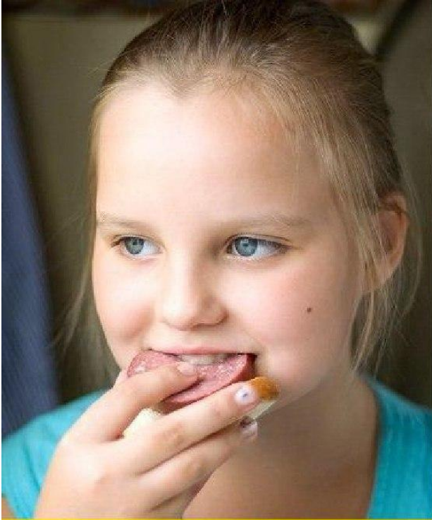
تعيش مع الجدة