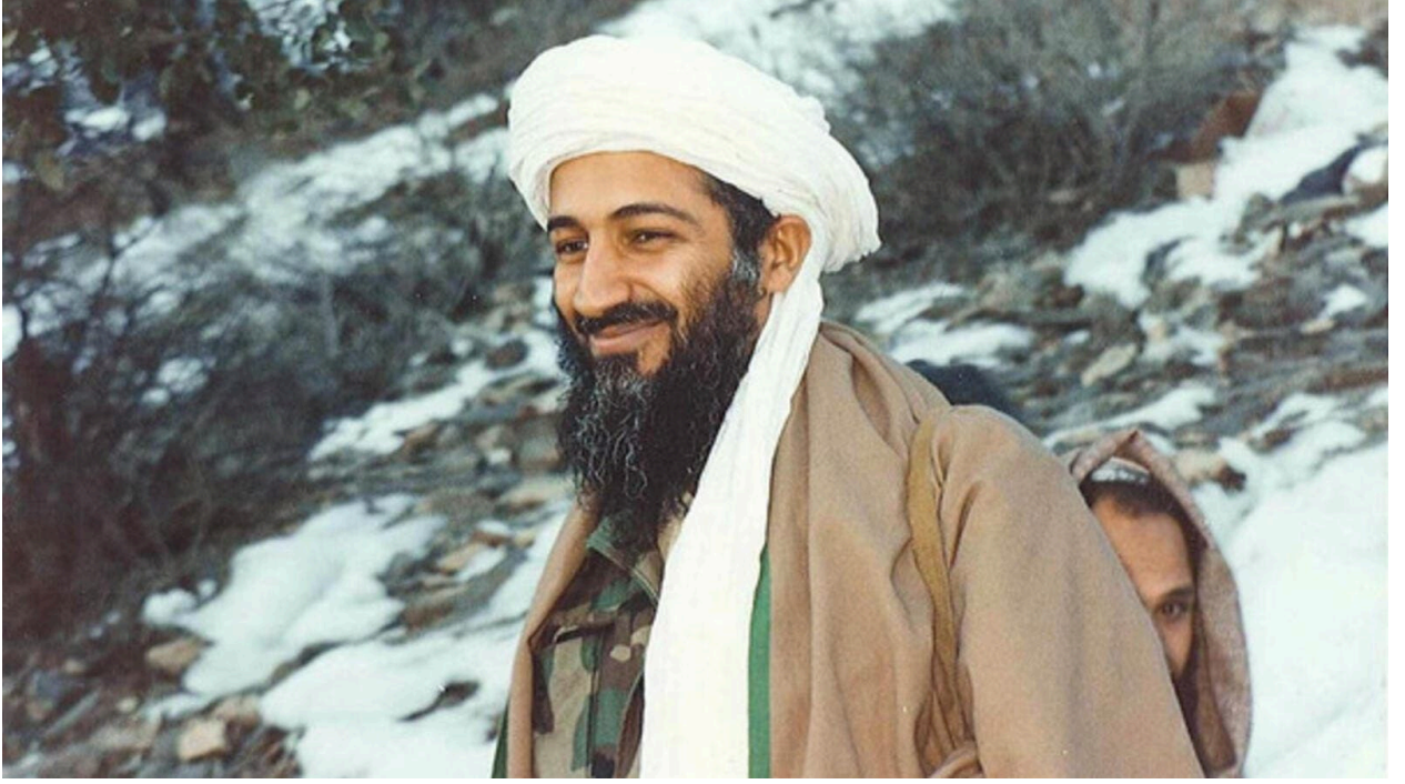
أسامة بن لادن (1957-2011)

فقد لاحظنا أنه بعد مقتل أسامة بن لادن لم ينته تنظيم القاعدة عن بكرة أبيه، بل تراجع في معقله، لكنه استمر في توسيع إمبراطورية الإرهاب بالخارج، سواء تعلق الأمر ببروز جماعات أعلنت ولاءها لهذا التنظيم العالمي المسلح أو تنظيمات أخرى تتقاسم نفس فكرة "إقامة الخلافة على مبدأ الوحدة الدينية".