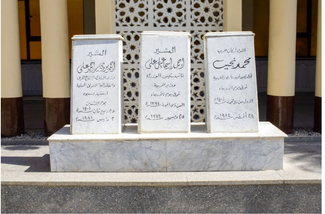
قبر محمد نجيب في القاهرة.