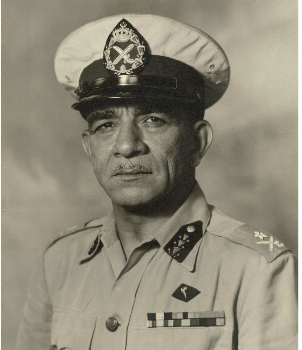
الرئيس المصري محمد نجيب ضحية نظام يوليو 1952.

ويرى نجيب أن بريطانيا احتلت السودان للتحكم في مياه النيل، ونهب ثروات السودان الطبيعة كالذهب، والسيطرة على جنوب أفريقيا، ومنع انتشار الإسلام جنوبًا، فبحسب نجيب حرص الإنجليز على إرسال المنظمات التبشيرية إلى الجنوب وتقوية الجنوبيين من أجل إخضاع الشماليين عند اللزوم.