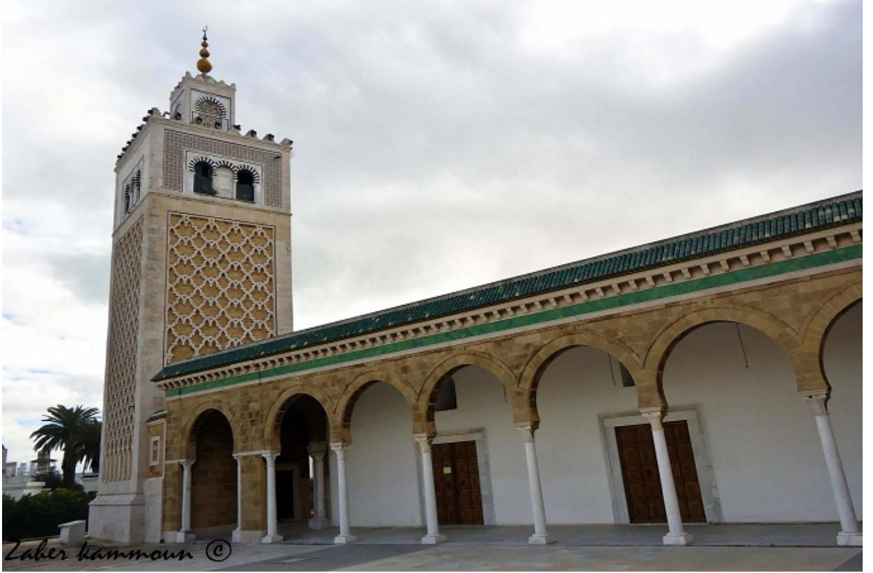
جامع القصبة أبرز مساجد الحفصيين

تتخذ صومعة الجامع من خلال مكوناتها الزخرفية شكل الصوامع الموحدية المغربية والأندلسية، حيث تتمدد الأقواس المتعددة الفصوص المنجزة بقاعدة الصومعة إلى الأعلى بواسطة تشبيكات تغطي واجهات الصومعة بسلسلة من المعينات، أما الجزء العلوي فينفتح بأقواس ثلاثية متجاوزة ومحاطة بإطار من التلبيس الخزفي، ويتوج الصومعة منور ذو تصميم مربع تزينه كوة ذات قوس متجاوز بكل واجهة.